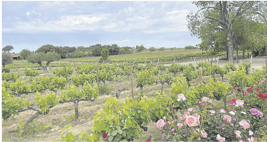
Coup d'œil sur les vignes du vignoble phare de la famille Torres à Vilafranca del Penedès, qui est situé à moins d'une heure de Barcelone.

Au début de mai, j'ai eu l'occasion de passer une très belle semaine en Espagne pour visiter quelques régions viticoles, dont le majestueux Priorat et le légendaire Penedès, où sont produits la majorité des vins mousseux espagnols. Le vignoble Albet i Noya, pionnier de l'agriculture biologique dans la région, est situé à moins d'une heure de Barcelone, à San Pau d'Ordal. Un domaine familial qui bénéficie d'un savoir-faire de cinq générations