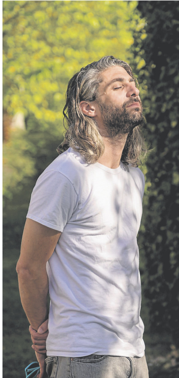
Le travail d'Adam Basanta, maintes fois récompensé, a été exposé dans plusieurs pays.