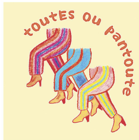
Le balado toutEs ou pantoute vient de lancer sa quatrième saison.

«C'est quand même un choix d'être en région et d'être plus isolés. Donc, on s'est créé un genre de petit espace où tous ensemble, on peut se nourrir soit de culture, soit de discussions. On crée finalement ce qui en ville est parfois