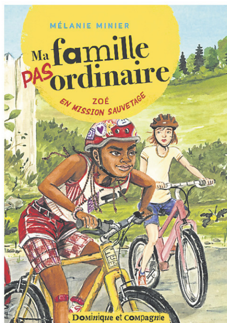
Publié chez Dominique et compagnie, Zoé en mission sauvetage est le deuxième tome de la série jeunesse Ma famille pas ordinaire .

À ceux ou celles qui voudraient se plonger dans les pages de Zoé en mission sauvetage , mais qui n'auraient pas lu le premier tome de la série Ma famille pas ordinaire , l'autrice promet une entrée facile dans cet univers, les illustrations de Stéphane Lauzon aidant à s'en imprégner rapidement, et des notes de bas de page expliquant même les quelques références au livre précédent.