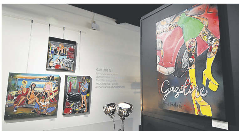
La proposition témoigne bien de la passion de l'artiste pour les moteurs.

vivantes et les courbes nombreuses qui caractérisent son travail. Puis il y a ces « longs cous », prêts à tous ses personnages, et qui remontent à loin.