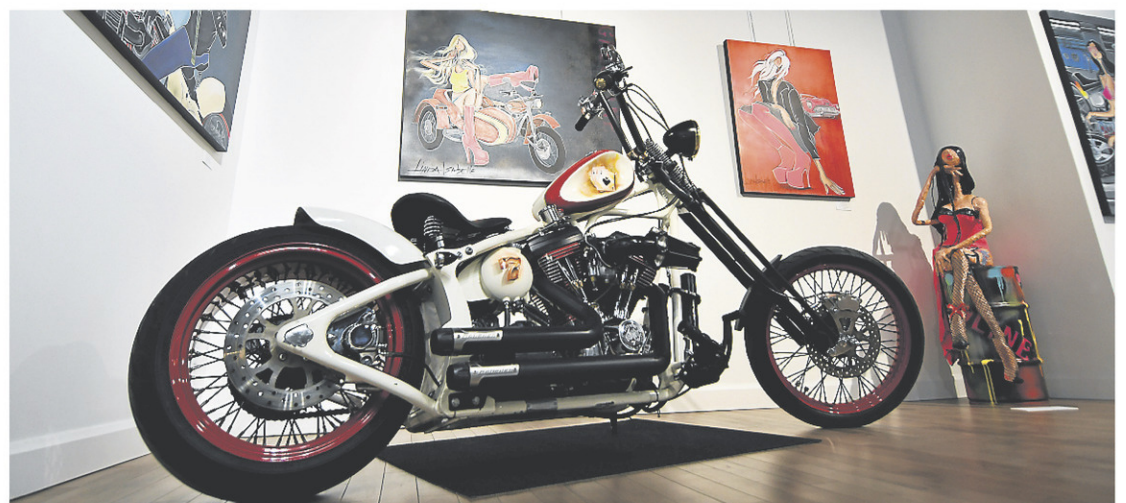
L'exposition Gazoline , de Linda Isabelle, est présentée jusqu'au 27 mai à la Galerie 5 de Jonquière.

Le vernissage de l'exposition aura lieu ce samedi à la Galerie 5 de Jonquière, en présence de l'artiste. Gazoline y restera ensuite accessible au public jusqu'au 27 mai, du mercredi au dimanche, entre 13 h et 16 h.