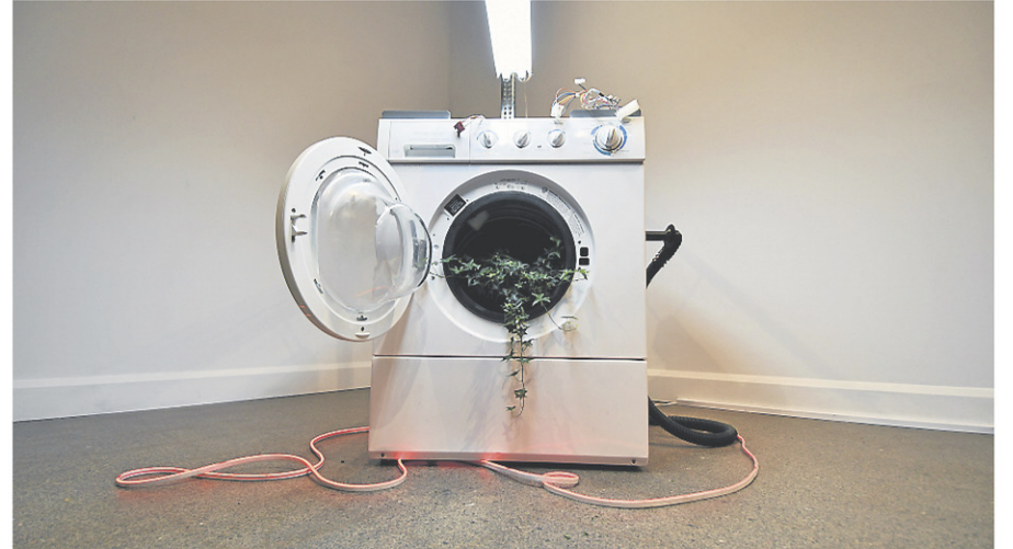
Adam Basanta se plaît à mélanger l'organique à des objets condamnés au dépotoir ou au recyclage.

Une plante qui pousse dans une craque de