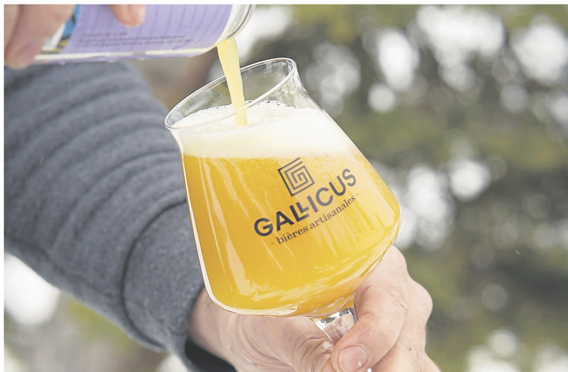
Cette année, Gallicus fête son quatrième anniversaire.