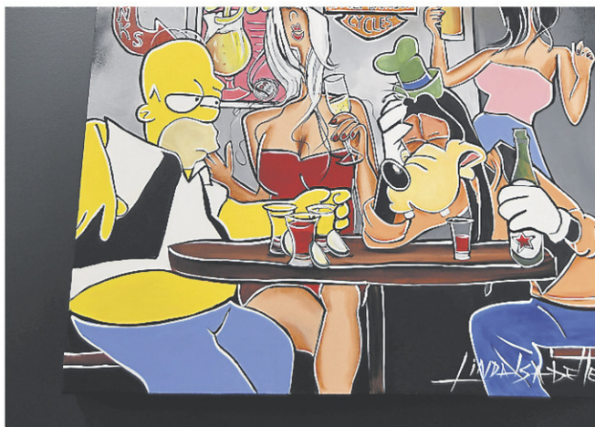
Gazoline accorde aussi une place à des personnages bien connus du public.