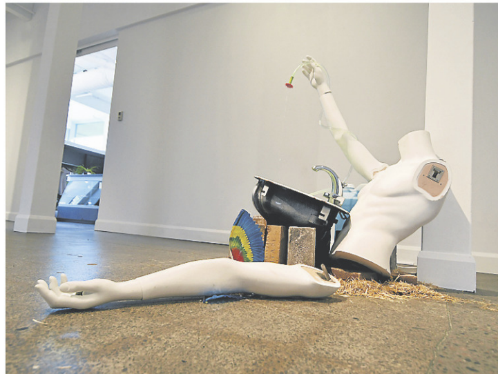
L'artiste crée des structures pratiquement vivantes, comme celle-ci, où l'eau circule en permanence.

Fidèle à ses habitudes, celui qui est né à Tel-Aviv, et dont le travail, présenté à plusieurs endroits dans le monde, a été récompensé plus d'une fois, est parti à la recherche de matériaux à son arrivée à Alma, en mars, trouvant notamment quelques pièces à l'écocentre de l'endroit. « Ça va devenir des ordures, ou du moins ça va être recyclé, mais c'est une façon de les amener à devenir autre chose pour un petit moment. »