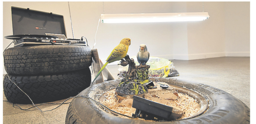
Jusqu'au 28 mai, le Centre d'art actuel Langage Plus, à Alma, accueille l'exposition The unknown futur rolls toward us ( Le futur inconnu roule vers nous ), d'Adam Basanta.