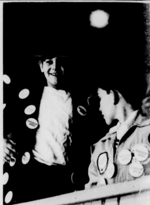
Deux des milliers de jeunes spectateurs de Bonjour Alain se sont bardés de boutons Bonjour Alain, à croire qu'ils ont l'intention d'en distribuer à tout leur quartier.