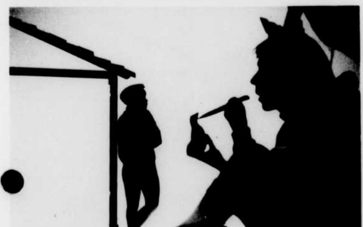
«La Boite à Surprise» présente un merveilleux théâtre d'ombres, mettant en vedette le Petit et le Grand, chaque mercredi à 4 h. 30 de l'après-midi.

Avec Jack Palance. Le cirque, ses mystères, ses émotions, ses événements spectaculaires, les êtres qui l'habitent, ses aventures extraordinaires.