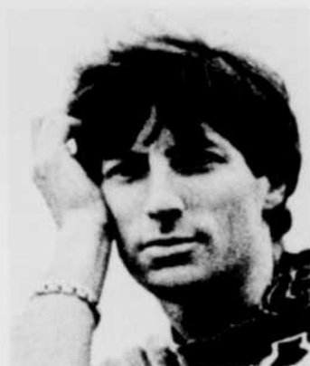
HUGUES AUFRAY que l'on verra deux fois à «Jeunesse oblige», cette semaine. Au «Club des Jnobs», lundi, et dans un «Spécial Hugues Aufray», mercredi.