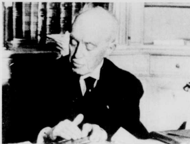
Louis de Broglie

A l'occasion du 75e anniversaire de naissance de Louis de Broglie, l'émission Documents présente, le 14 avril à 9 heures, à la radio de Radio-Canada, un Hommage au duc Louis de Broglie .