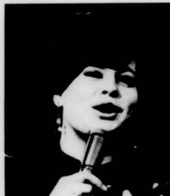
GINETTE RENO sera à l'émission radiophonique «Place aux femmes», le jeudi 13 avril à 2 h. 30.