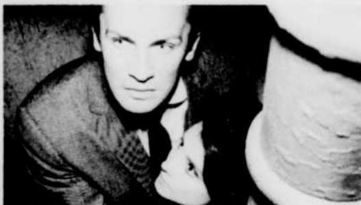
ROY THINNES et DIANE BAKER, dans «Les Envahisseurs».

Une série tout aussi passionnante sera à l'horaire du lundi soir à 8 h. 30, à compter du 1er mai. Ce sont les Envahisseurs , avec le séduisant comédien américain Roy Thinnes. Cette série de science-fiction met en scène des êtres venus d'une autre planète, en soucoupe volante.