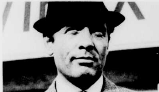
PATRICK MCGOCHAN, dans «Le Prisonnier».

En septembre, Radio-Canada aura le plaisir de présenter aux téléspectateurs, en «première nord-américaine», une série post-synchronisée expressément pour la Société. Cette série s'intitule le Prisonnier et met en vedette l'excellent acteur Patrick McGoohan, qui jouait avec tant de brio le rôle-titre de la série «Danger Man».