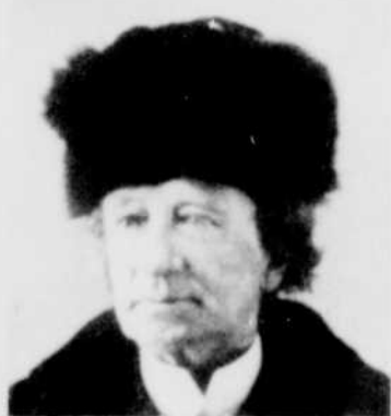
John A. Macdonald