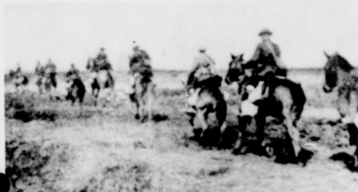
La cavalerie canadienne sur la crête de Vimy.

Pour les auditeurs et les téléspectateurs de Radio-Canada, jeunes ou vieux, l'anniversaire de Vimy sera l'occasion d'évoquer un des gestes héroïques de notre peuple qu'un lointain gouverneur qualifiait de «sans histoire».