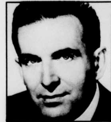
Le baryton Gérard SOUZAY sera entendu aux «Chefs-d'oeuvre».

21 h 00—RADIOJOURNAL 21 h 03—CARREFOUR DES ARTS 00 h 00—RADIOJOURNAL