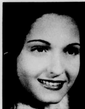
«Une jeune fille sage» de Carmine Gallone, le lundi 25 à 13 h 00.