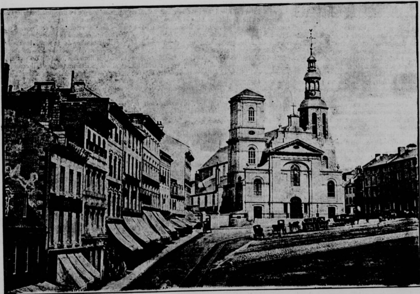
LA BASILIQUE DE QUEBEC Photographie Vallée.—Photo-gravure par Armstrong