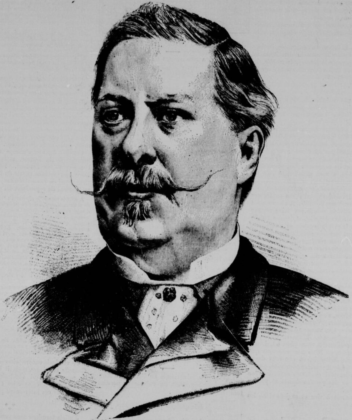
S. M. DOM LUIS IER, ROI DE PORTUGAL, DÉCÉDÉ