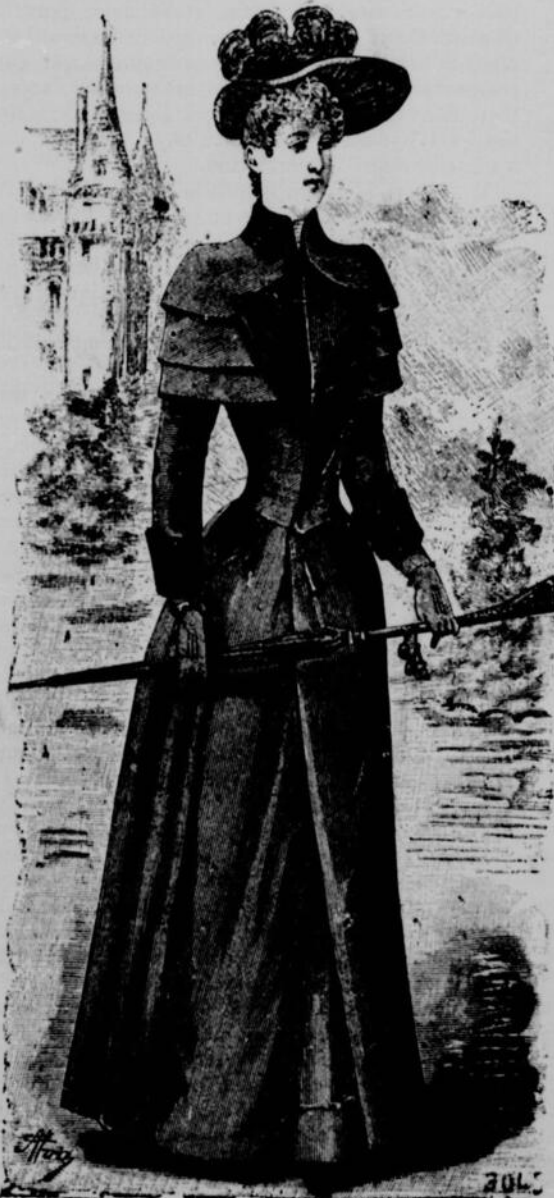
No 2.—Manteau Robespierre