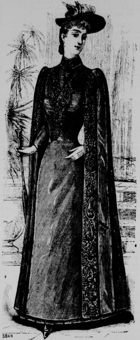
No 1.—Grand manteau en drap vert bouteille

Nos lectrices trouveront dans une autre page l'explication des deux gravures ci-dessus.