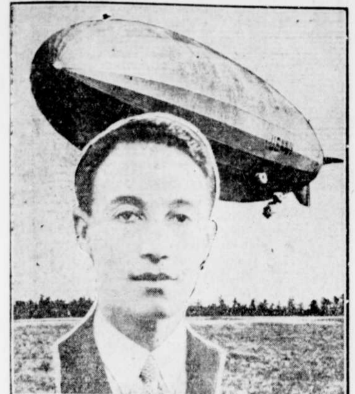
SIR PHILIP SASSOON, son secrétaire de l'aviation pour la Grande Bretagne et trois assistants secretsaires américains, est l'auteur de la dirigeable "Los Angeles" de la marine américaine, qui se rendra au Canada, à Ottawa, le 29 octobre. Dans le médaillon est Sir Philip Sassoon.