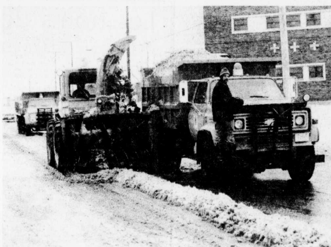
Il était assez curieux de voir, hier, dans les rues de Victoriaville, les responsables de la voirie se promener avec leur équipement pour amasser la neige... qui fondait d'elle-même.

comme il est actuellement. Disant que la position officielle sera connue au sortir de cette réunion du Conseil d'Administration, M. Duguay a mentionné qu'il est fort possible que le CRIS agisse comme un embryon de CLSC à Victoriaville.