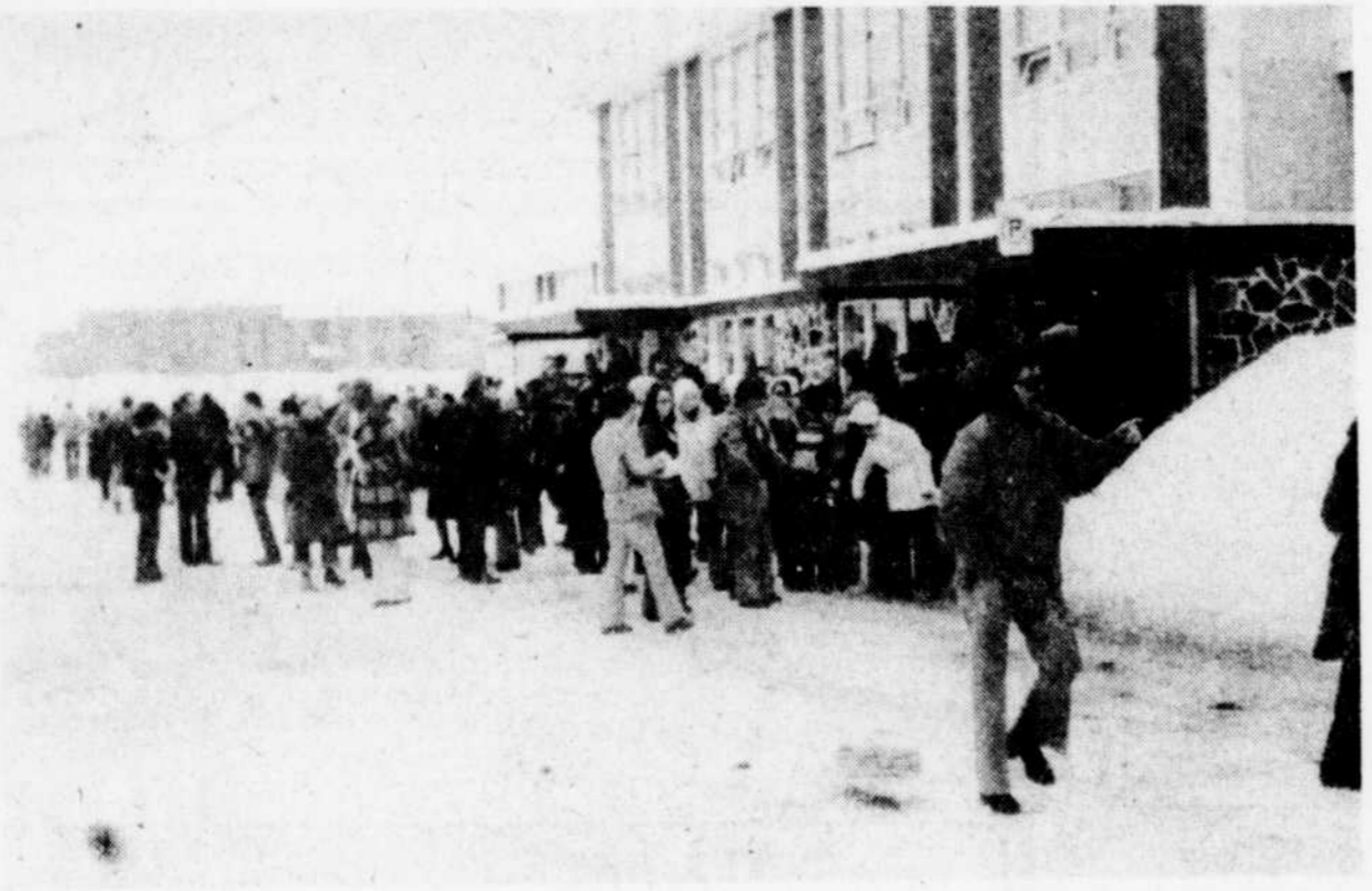
Ce groupe de syndiqués de la région de Thetford Mines, membres du Front commun du secteur public et para-public, se prépare à se rendre au Centre

St-Ferdinand, des enseignants des trois Commissions scolaires francophones du territoire de l'Amiante (CEQ), d'autres du Collège de Thetford Mines, des syndiqués de différents Centres d'accueil, du Service social, des professionnels non-enseignants sans oublier le personnel de soutien des institutions scolaires.