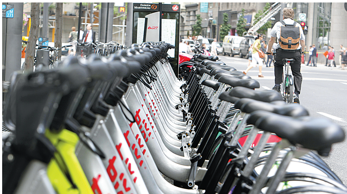
Le système de vélo en libre-service développé par la Ville de Montréal connaît beaucoup de succès à l'étranger.

Québec avait notamment demandé à la Ville de se conformer aux recommandations du vérificateur général de la Ville, a-t-il dit. Rappelons que, dans un rapport sur Bixi en 2011,