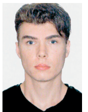
Luka Rocco Magnotta

Le torse de Lin a été retrouvé dans une valise abandonnée dans une ruelle près du logement de Magnotta, le 29 mai dernier sur le boulevard