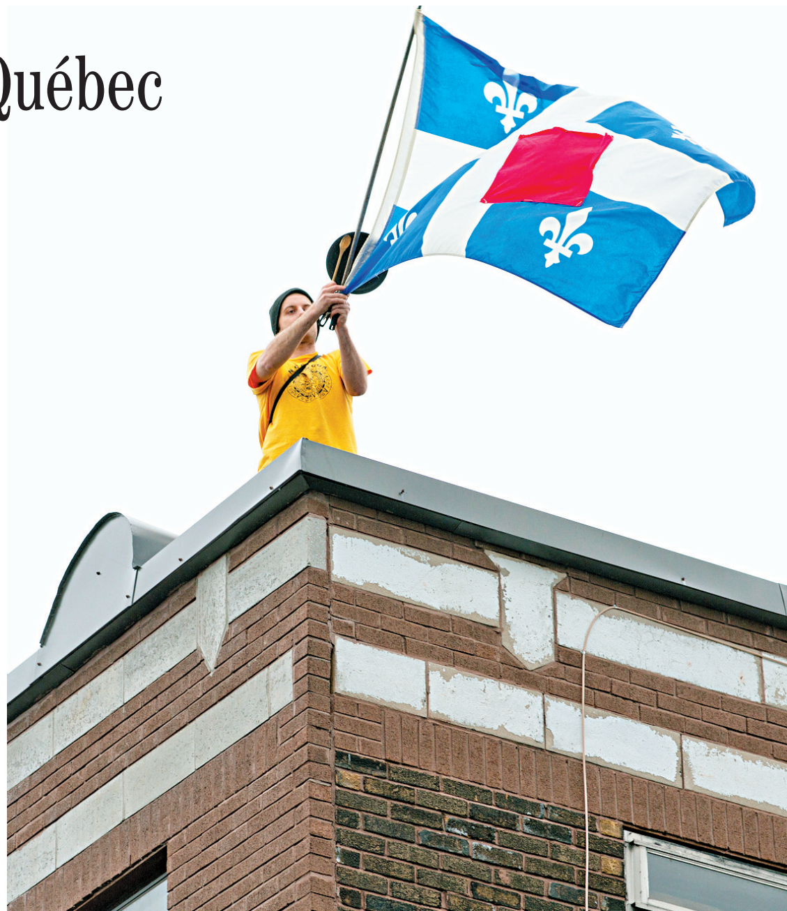
Un jeune manifestant juché sur le toit d'un immeuble, samedi dernier, à Montréal

En admirant cette jeunesse qui découvre et qui se révolte, j'imagine, dans leur tombe, le sourire de René Lévesque, de Marcel Rioux, de Pierre Perrault, de Gaston Miron, de Pierre Vadeboncoeur, de Pierre Falardeau... Mais, en même temps je me dis que, avec ce clivage historique gauche-droite, les débats et les référendums vont se durcir au Québec, dangereusement.