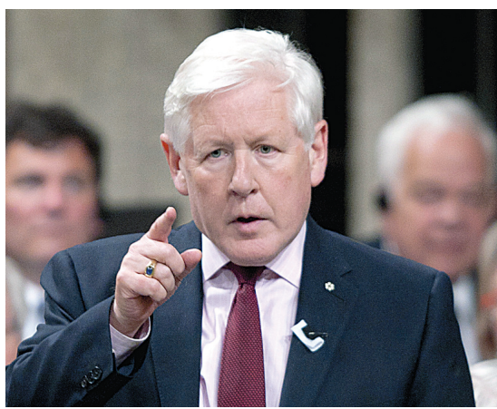
Bob Rae portant le carré noir sur fond blanc, hier, à la Chambre des communes.