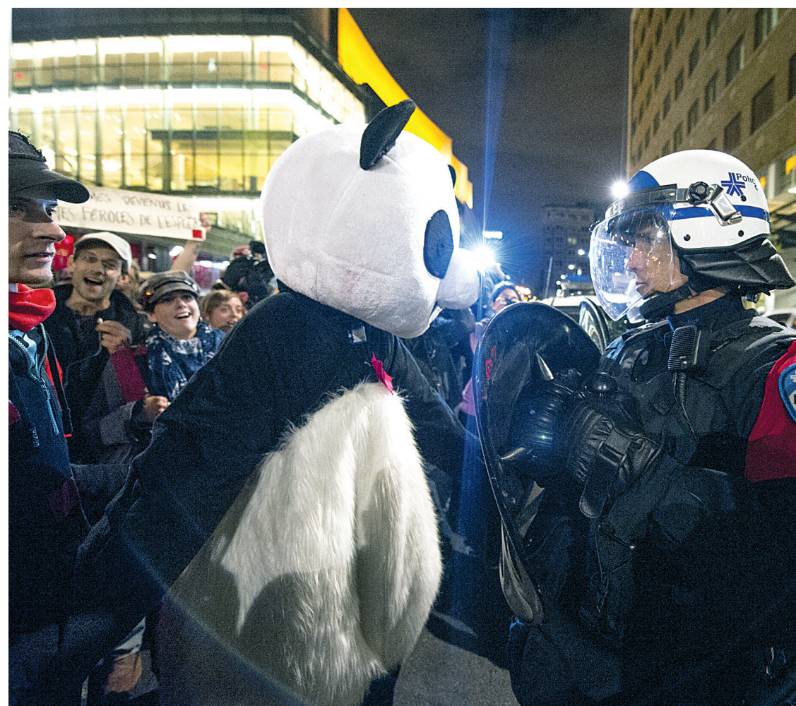
Le citoyen derrière Anarchopanda entend déposer une requête en nullité contre le règlement antimasque de la Ville de Montréal.