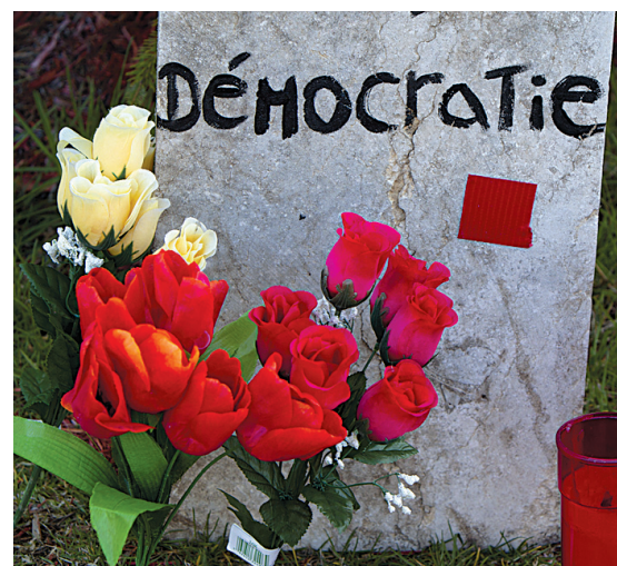
Le carré rouge n'appartient pas à un parti, mais bien au mouvement étudiant.