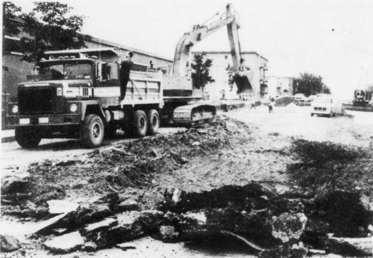
Section de la rue Galt ouest fermée

Le ministère rappelle aux contribuables qu'ils peuvent communiquer avec le bureau de Revenu Québec le plus près ou, s'ils doivent utiliser l'interurbain, de composer le "0" et demander Zenith Revenu Québec.