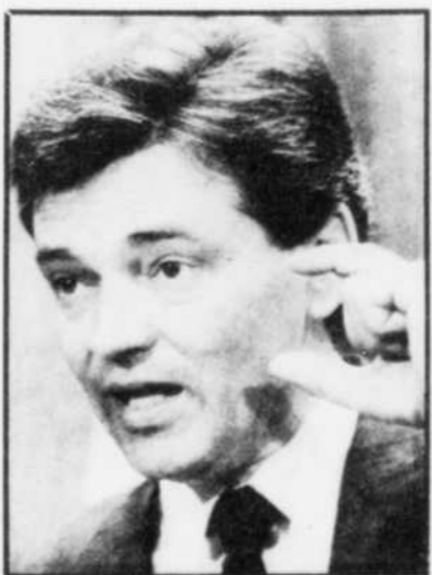
Le ministre Michel Pagé

Le projet de loi 46 prévoit ainsi qu'il sera possible pour une femme d'emprunter pour l'achat d'une ferme même si elle ne s'y trouve aucun bâtiment et aucune machinerie, en autant qu'une ferme d'encadrement assure par contrat la réalisation des travaux ou la fourniture des biens.