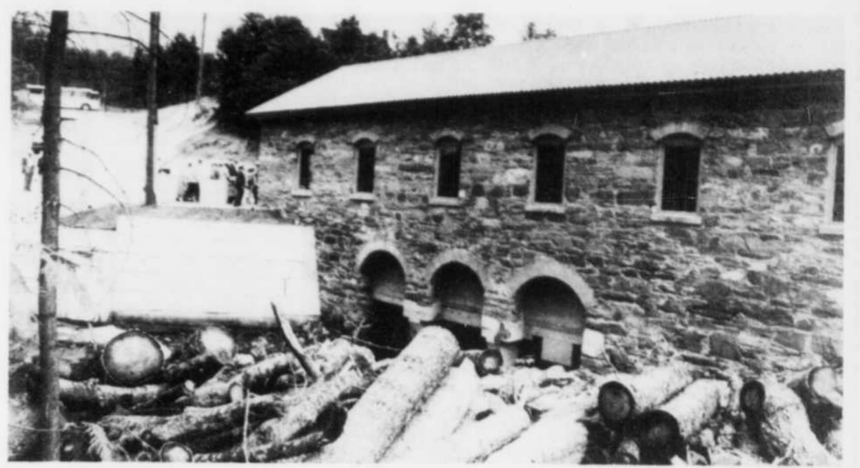
La vieille centrale hydroélectrique Eustis, toute construite de pierre des champs en 1903, fournit 700 kilowatts depuis hier, après d'importants travaux de reconditionnement qui ont duré un an et demi et coûté 1,5 million $.

En fait, c'est encore bien peu dans le réseau d'Hydro-Sherbrooke, qui produisait déjà 15.000 kilowatts en six endroits avant que la centrale Eustis reprenne vie. C'est encore moins si on compare avec les besoins en électricité des Sherbroo-