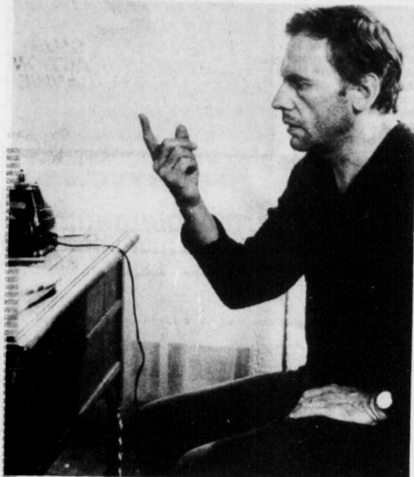
Jean-Louis Trintignant ne sera pas un policier comme les autres dans L'homme aux yeux d'argent .

"Alors je m'applique à me conduire de façon gentille avec les autres et je refoule la méchanceté qui sommeille en moi comme un fond de chaque homme... ou plutôt je l'accumule en moi et ne la libère que devant les caméras lorsqu'on me demande de jouer les vilains."