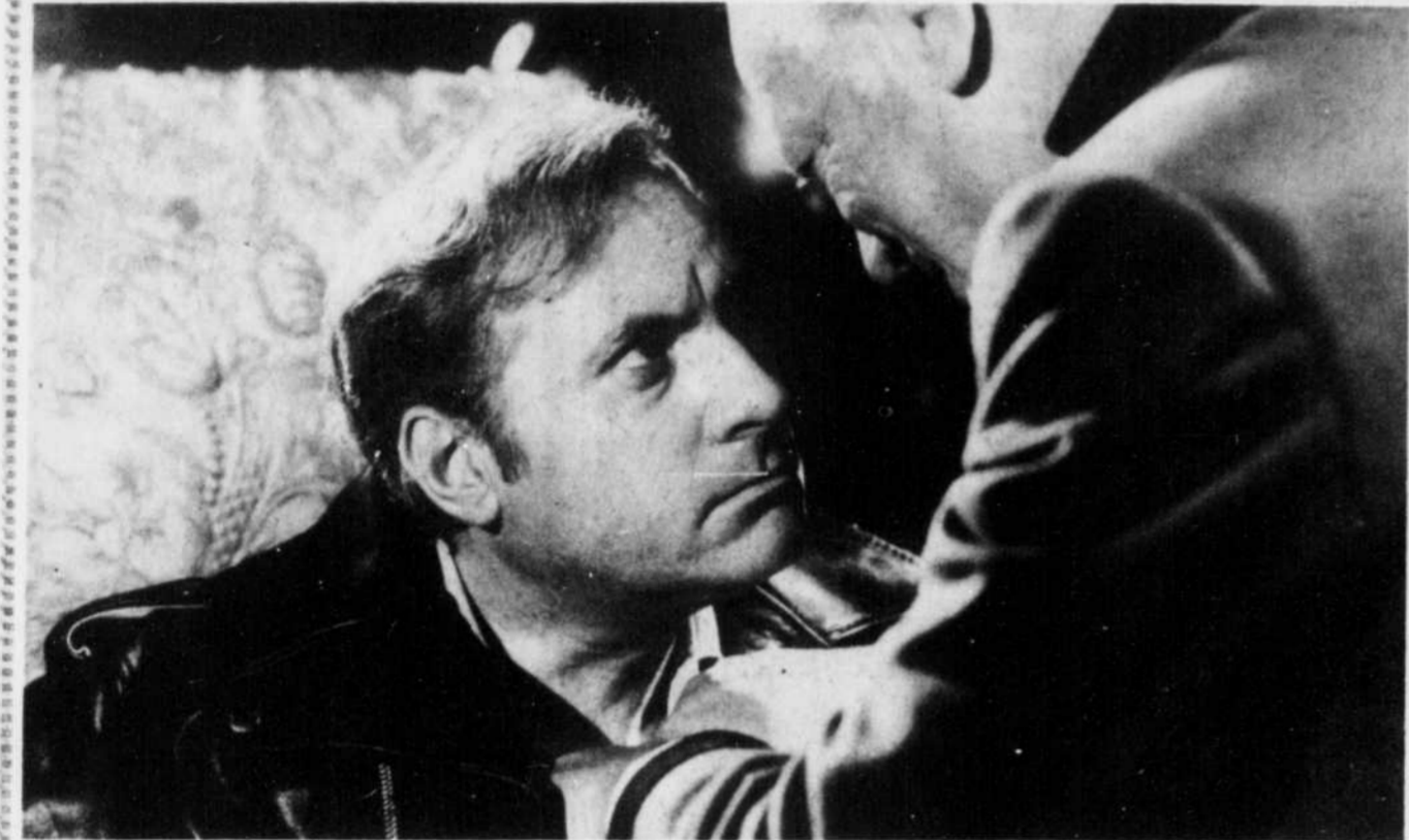
Michel Serrault campera un autre un policier dans On ne meurt que deux fois , le prochain film de Jacques Deray.

"Mon souci n'est pas de briller, c'est de jouer des rôles de qualité et différents", a-t-il déclaré récemment. "J'aime varier les genres d'un film à l'autre car, pour un acteur