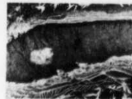
FAHRENHEIT 32° "GEL et DEGEL"