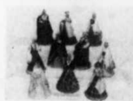
FIGURINES DE CERAMIQUE LETTONES