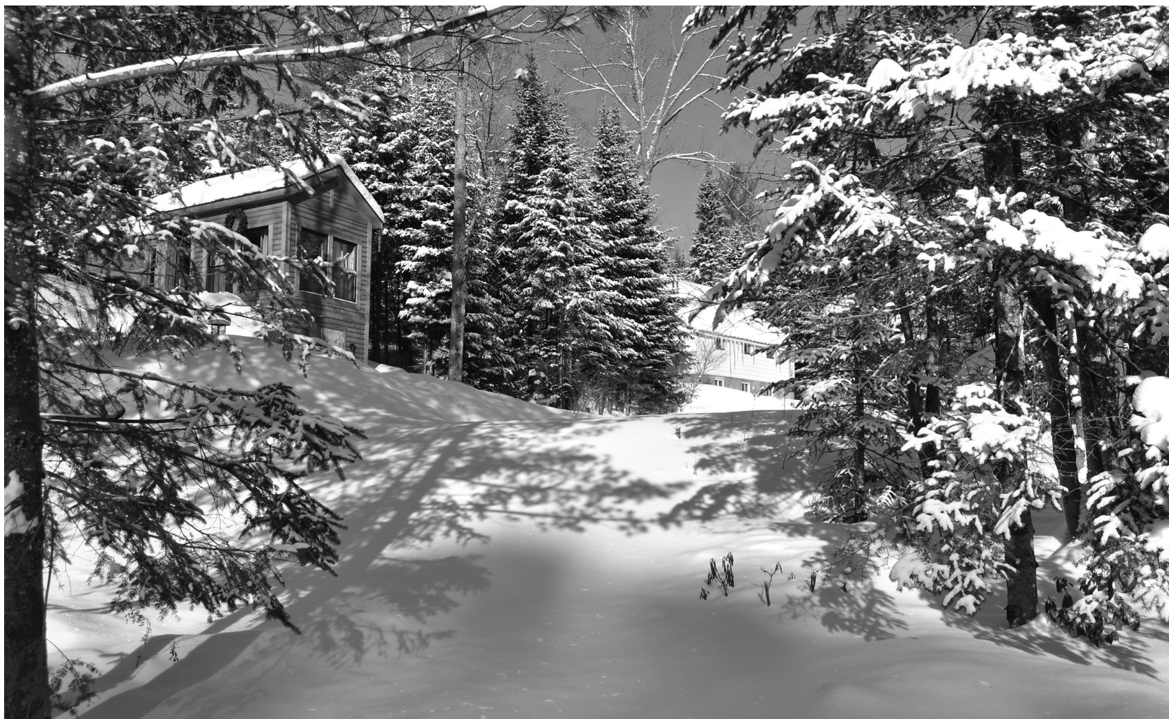
GENEVIÈVE TREMBLAY LE DEVOIR

«Le but est d'harmoniser les chalets avec les