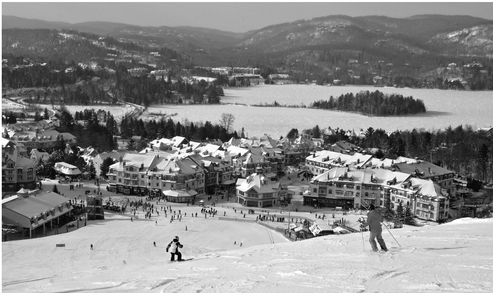
Le colosse compte 96 pistes, 14 remontées, 4 versants, 3 parcs à neige, 875 mètres d'altitude et 645 mètres de dénivellé.

Pour s'assurer de ne pas laisser s'égarer les