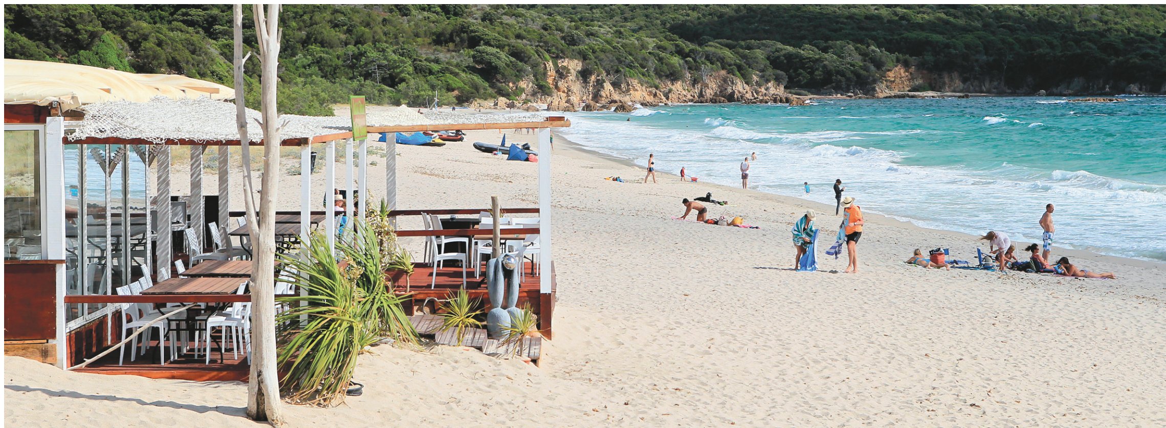
La plage Cupabia de Coti-Chiavari, en Corse.

Pour les friands de légendes corses autour d'un feu de foyer ou d'une piscine d'eau minérale qui surplombe l'une des vallées de la Castagniccia, il y a un lieu unique à Carchetto, Torre di Tavola, qui est un gîte comprenant plusieurs appartements louables à la semaine.