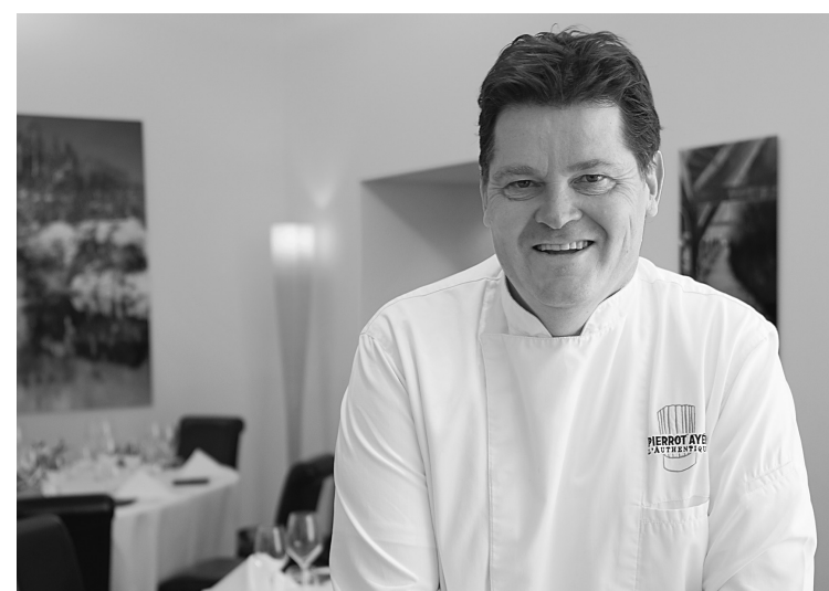
RESTAURANT LE PÉROLLES

La raclette, spécialité culinaire typiquement suisse s'il en est, figure parmi les plats préférés des passagers de Swiss. Eh oui, le transporteur la sert même en vol! Ici, en demi-meule au coin du feu au restaurant La Grange à Evolène, dans le Valais.