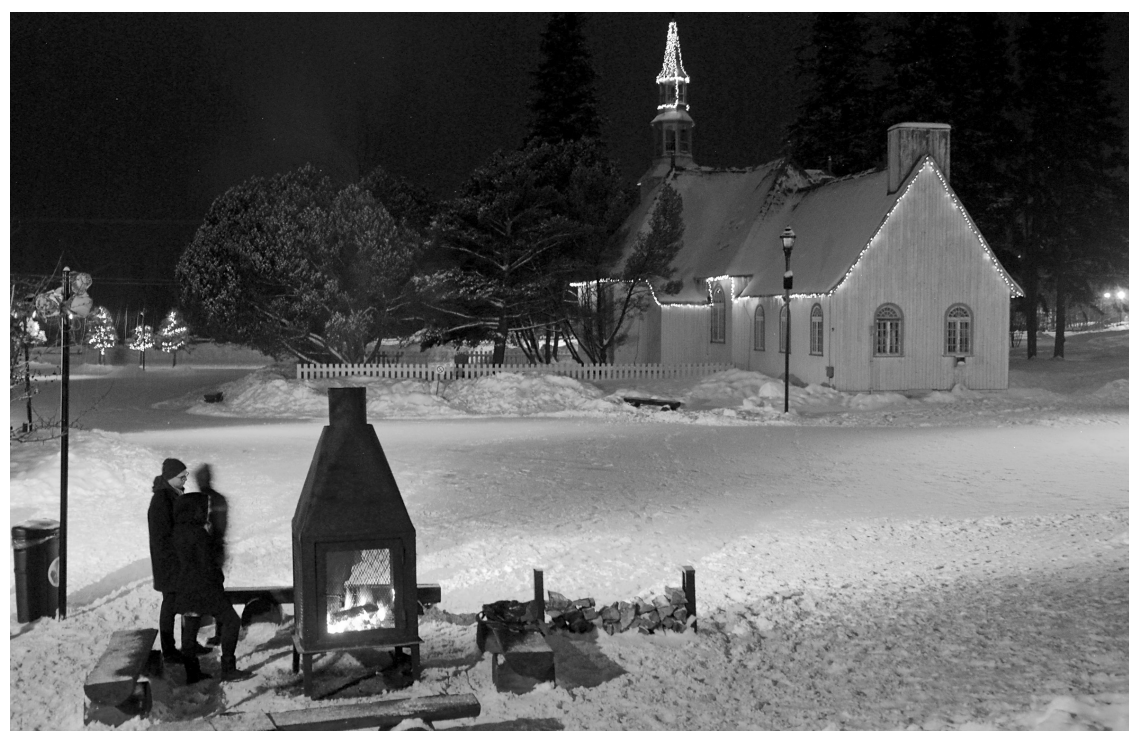
Jour et nuit, une foule d'activités sont offertes à Tremblant, pour tous les goûts.

S'y rendre. Prendre l'autoroute 15 Nord puis la route 117 jusqu'à la sortie 119 (Montée Ryan) pour le village piétonnier et le versant Sud (environ 90 min.). Pour le versant Nord, bifurquer par le chemin Duplessis ou emprunter le chemin du Lac-Supérieur via Saint-Faustin. Sur place (au village): service de « valet ski », halte-gardiennage, cinéma... Abonnez-vous à l'infolettre