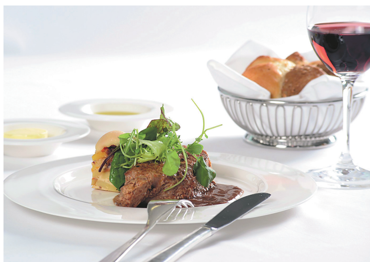
Au menu de la Première classe du transporteur aérien Swiss: un steak de veau, sauce soubise; et à droite, à celui de la classe Affaires: esturgeon au sugo de tomates et d'artichauts. Des plats signés The Chedi Andermatt, un hôtel cinq étoiles du canton d'Uri.

Mais, avec son programme Swiss Taste of Switzerland (SToS), né en 2002 comme la compagnie et destiné à ses classes Affaires et Première, Swiss va beaucoup plus loin.