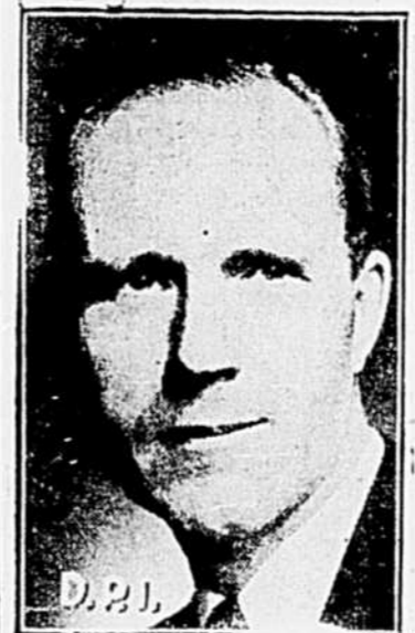
L'Hon. Angus L. Macdonald, mi- nistre de la Défense nationale, service naval.