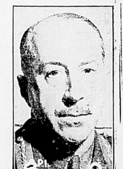
Le major-général H. D. Crerar, chef de l'état-major général du Canada.