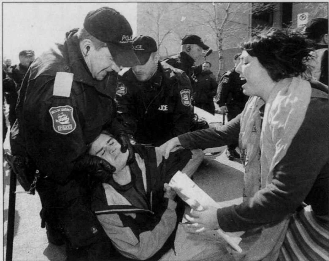
Une dizaine d'étudiants ont investi hier matin le complexe G et occupé les bureaux de la Direction générale de l'aide financière aux études, au 21 e étage. Après trois heures d'occupation, ils ont été délogés par les policiers, qui ont procédé à deux arrestations. En après-midi, plus de 5000 cégépiens, universitaires et quelques élèves de 4 e et 5 e secondaire ont manifesté devant le parlement. Ils ont ensuite défilé dans les rues de Québec jusqu'à l'Université Laval.

Le Devoir est publié du lundi au samedi par Le Devoir Inc. dont le siège social est situé au 2050, rue De Bleury, 9 e étage, Montréal, (Québec), H3A 3M9. Il est imprimé par Imprimerie Québec World, 36, Jean, 800, boulevard Industriel, Saint-Jean-sur-Richelieu, division de Imprimeries Québec Inc., 612, rue Saint-Jacques Ouest, Montréal. L'Agence Presse Canadienne est autorisée à employer et à diffuser les informations publiées dans Le Devoir. Le Devoir est distribué par Messageries Dynamiques, division de Corporation Sun Media, 900, boulevard Saint-Martin Ouest, Laval. Envoi de publication — Enregistrement n° 0858. Dépôt légal: Bibliothèque nationale du Québec.