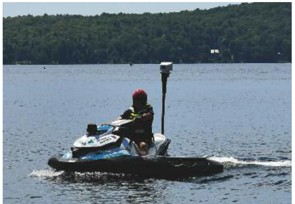
Saint-Hippolyte est l'une des trois municipalités à posséder ce modèle de motomarine appelé Search and Rescue.

Ceci dit, « les patrouilleurs ont comme but premier la prévention pour éviter une tragédie, insiste M. Dagenais. On veut prévenir une situation d'urgence. Le but n'est pas d'empêcher