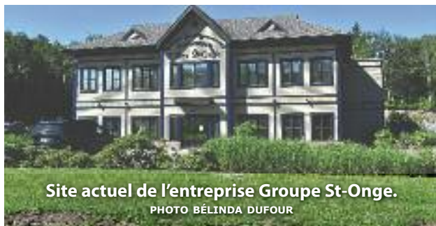
Site actuel de l'entreprise Groupe St-Onge.

C'est suite à de longues réflexions que nous vous annonçons que le Groupe St-Onge cessera ses activités au niveau du génie civil et des projets commerciaux afin de se concentrer dans le domaine de l'excavation résidentielle. Bref, nous tournons une page d'histoire pour en écrire une nouvelle.