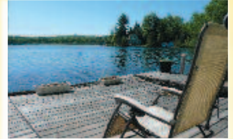
BORD LAC ECHO – Très belle résidence 2016! Vue magnifique! 2 étages et rez-de-jardin. 5 CAC, 3 s./bains, 2 foyers. Large fenestration en façade. 50 min. de Mtl. MLS 27226431. 689 000 $