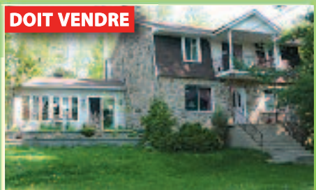
SECTEUR LAC CONNELLY – Belle propriété d'antan! Habillée de pierre autant à l'intérieur qu'à l'ext. 3 CAC + BUR. 2 foyers. Chaleureuse. Ter. : 36 360 p.c. MLS 15518554. 224 900 $

450 563-5559 www.immeublesdeshauteurs.com 2264, chemin des Hauteurs, Saint-Hippolyte