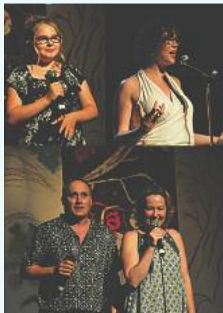
Concert d'été, école Le cœur à chanter.

Lors de ce concert, au-delà des mélodies et des interprétations lyriques, les chanteurs partageaient généreusement leurs ressentis dans l'interprétation de leurs deux pièces choisies par eux et travaillées pour ce concert. Ainsi on a assisté à l'interprétation de pièces classiques dont l'une, celle d'une jeune chanteuse, où les paroles en italien étaient