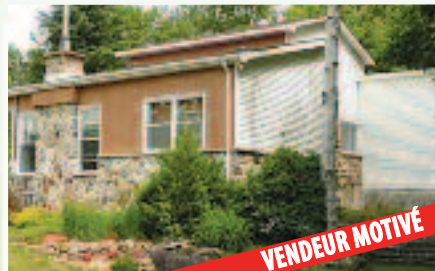
SAINT-HIPPOLYTE – Maison de 3 CAC, foyer au bois. Secteur paisible avec forêt invitante!. MLS 23106420. 135 000 $