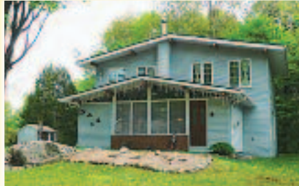
2 ACCÈS AU LAC BLEU – Maison à 2 étages. Accès not. au lac Bleu à 2 pas de la propriété. 3 CAC, 2 SDB. Secteur paisible. MLS 18752113. 224 900 $