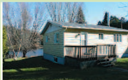
BORD LAC SIESTA – Saint-Calixte. Plain-pied 1980. Fondation béton. 2 CAC. S.-sol fini. Ter. 15 540 p.c., plat. MLS 28737112. 175 000 $