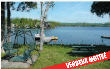
BORD LAC CONNELLY – Vue panoramique! Grand pl.-pied. S.-sol pl. grandeur. Ter. plat de 34 257 p.c. 2 garages doubles. MLS 27485942. 799 000 $