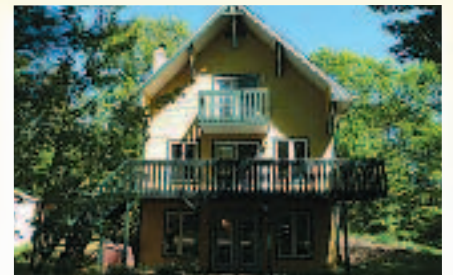
SAINT-HIPPOLYTE – Belle grande maison! 3 CAC, 3 s./bains, comb. lente. 1 er étage (rez-de-jardin). Idéal pour travailleur autonome. MLS 17000910. 249 000 $