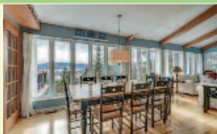
VUE! VUE! VUE! – Vue panoramique! Cottage impeccable! 4 CAC, solarium, foyer. 2 SDB. Piscine hors-terre. MLS 12584393. 399 000 $