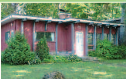
SECTEUR LAC CONNELLY – Plain-pied, 3 CAC, foyer au bois, vue sur l'eau. Ter. : 7961 p.c. Rue paisible. MLS 16676140. 99 000 $