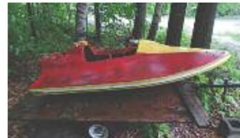
Bateau servant aux Régates au lac de l'Achigan.