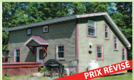
ACCÈS NOT. LAC EN CŒUR – À 2 min. à pied de l'eau. Propriété entièrement rénovée. Comb. lente. 2 CAC. Ter.: 39 918 p.c., privé. MLS 14191723. 189 000 $