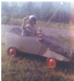
1969, Alain conduisant une « boîte à savon » lors d'un concours organisé au village, lors du Centenaire.

Chez Alain, l'intérêt pour tout ce qui était mobile et mécanique a commencé jeune. « En 1969, je me souviens d'avoir gagné un trophée à une course de boîtes à savon organisée lors des festivités du centenaire de Saint-Hippolyte. Le circuit partait de l'hôtel Central, coin chemin du lac de l'Achigan jusqu'à l'entrée du Mont-Tyrol. Pour des enfants, c'était vite et long! Puis, je me souviens aussi qu'à l'été de mes 13 ans, en 1972, je flânais souvent au garage automobile Volkswagen de Pierre Viau, voisin de la maison familiale (le garage était sur l'emplacement actuel du garage Gingras, chemin du lac de l'Achigan). Lorsque c'était possible, je donnais un coup de main et surtout, j'observais et posais beaucoup de questions. Une chance que monsieur Viau était patient! Mais, j'oubliais vite le garage lorsqu'il était question de pêche. Car chez les Boucher-Clément, la pêche était le sport roi parmi tous! Tous les membres de la famille Boucher (famille de ma mère) étaient de grands amateurs de pêche. Ils connaissaient les meilleures fosses à truite mouchetées des ruisseaux avoisinants, tout comme l'emplacement des meilleurs nids d'achigan, de truite grise ou de barbotte du lac Achigan. »