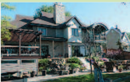
BORD LAC CONNELLY – Superbe propriété bord lac motorisé. Vue panoramique! Entièrement rénovée en 2008. Pièces spacieuses. Ter. paysager. 50 min. de Mtl. MLS 17524139. 984 000 $