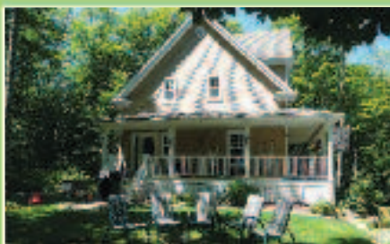
LAC DE L'ACHIGAN – Cottage champêtre 2009. Accès au lac de l'Achigan. 3 ch. à l'étage. 2 s./bains. Foyer. Ter. : 44 800 p.c. MLS 10807107. 345 000 $