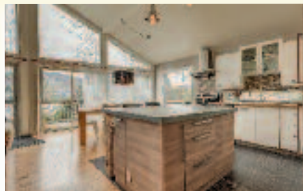
LAC DE L'ACHIGAN – Vue et place au quai. Plain-pied 1995. 3 CAC, 2 s./bains, comb. lente, sous-sol fini. Rez-de-jardin. Terrasse avec vue! MLS 13951704. 387 000 $