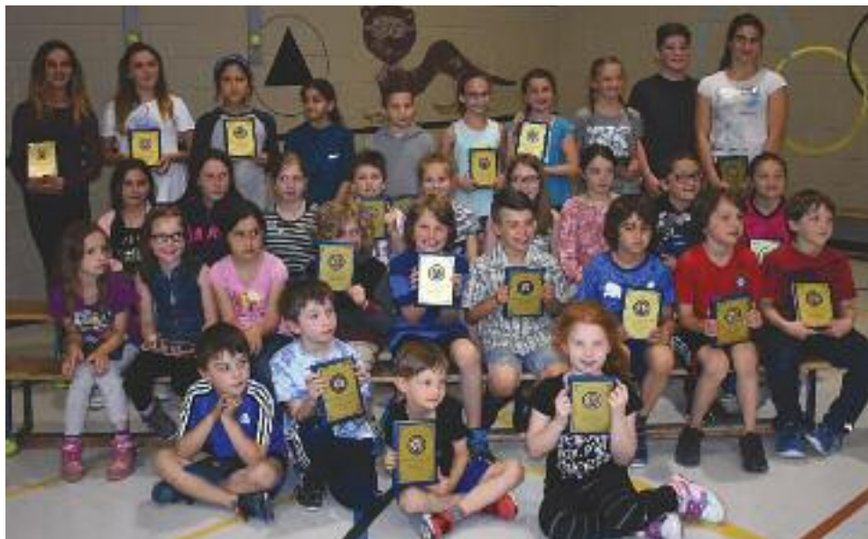
Les regards des jeunes nominés du Gala Méritas sont empreints d'étonnement, de joie et d'excitation.