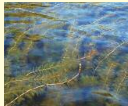
Myriophylle à épi.

Les plantes aquatiques exotiques envahissantes, comme le Myriophylle à épi, peuvent se définir comme des plantes ayant été introduites hors de leur aire de répartition géographique naturelle et dont l'établissement et la propagation constituent une menace pour l'environnement, pour l'économie ou la société.