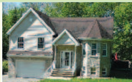
SAINT-HIPPOLYTE – Propriété 2003, 4 CAC, 2 s./bains. Garage adjacent. À 1 min. de tous les services, 10 min. de Saint-Jérôme. 275 000 $