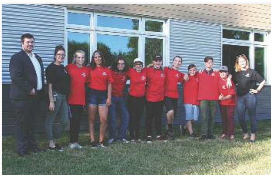
L'équipe du CIEC pour l'été 2018.

Date de tombée : le 1 er du mois Tirage : 5400 copies