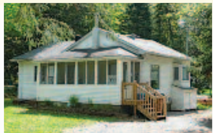
ACCÈS NOT. LAC CONNELLY – Plain-pied rénové. Accès à 300' de la maison. 1 CAC, foyer. Ter. de 31 510 p.c. Secteur paisible! Occup. immédiate. MLS 24663444. 159 000 $