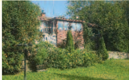
BORD LAC BLEU – Plain-pied avec 105' en bordure du lac. 3 CAC. Foyer comb. lente. Garage 12' X 23'. Abri d'auto. Occup. immédiate. MLS 21756740. 199 000 $