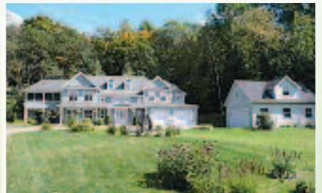
LAC DE L'ACHIGAN – Propriété avec vue imprenable face au lac. Ter. de 74 016 p.c. avec 1 938 p.c. bord de l'eau. Privé. Plage de sable. Sud-ouest. MLS 18930371. 1 025 000 $