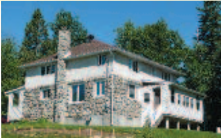
SAINT-HIPPOLYTE – Grande propriété 2 étages. 3 CAC + bur, 1 SDB, 1 S.-E., cuisinière antique fonctionnelle. Garage double. MLS 27176064. 244 900 $