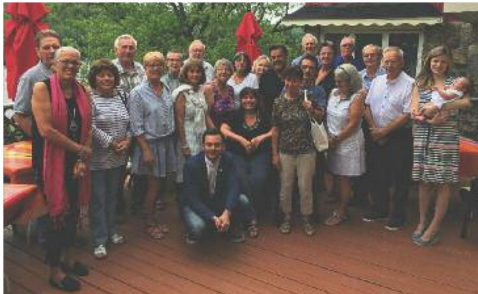
C'est plus d'une trentaine de retraité(e)s des municipalités de Prévost, Sainte-Sophie, Saint-Hippolyte, Piedmont et Saint-Sauveur qui se sont regroupés mercredi, 13 juin, à l'Auberge lac du Pin rouge de Saint-Hippolyte, pour former le « Regroupement des retraité(e)s pour Paul dans Prévost ».