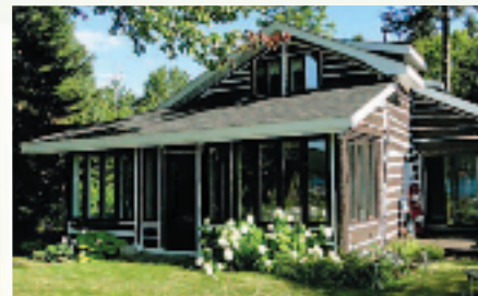
BORD LAC DE L'ACHIGAN – Unique! Vue panoramique! Franc sud. Cachet rustique! 3 ch. à coucher. Comb. lente. Ter. plat. Superbe plage de sable. MLS 18739246. 475 000 $