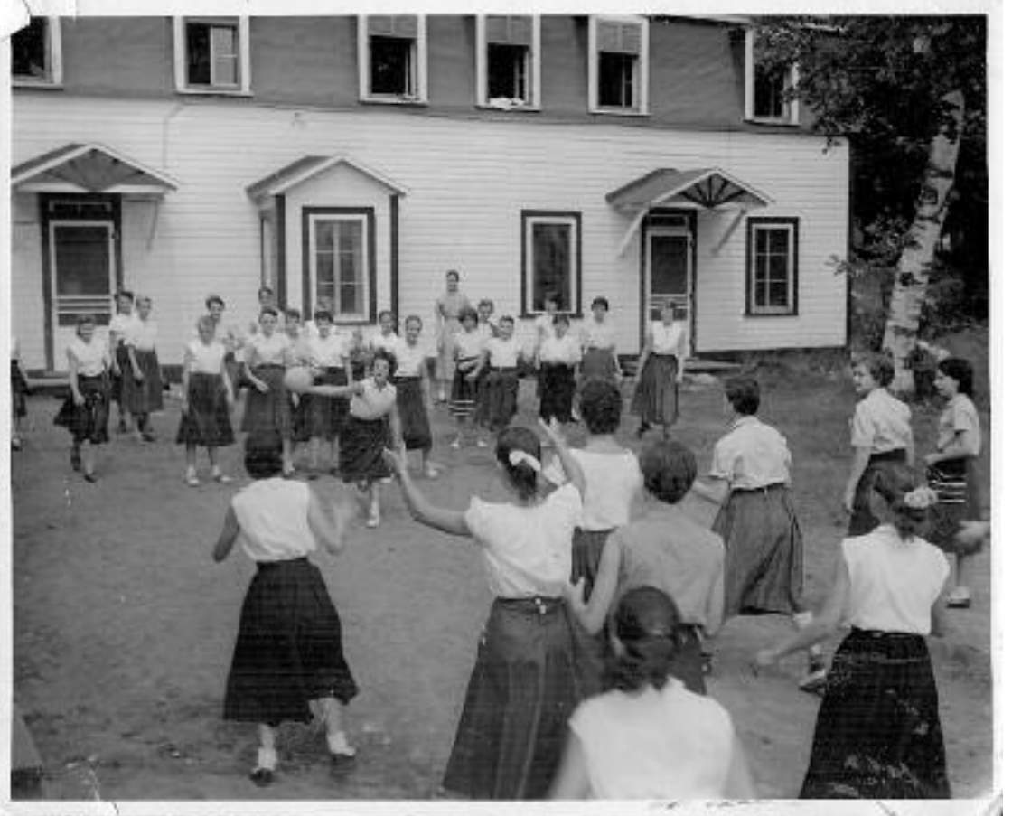
Un groupe de jeunes filles fréquentant le camp Bruchési à l'été 1956.

Tous les après-midis, il y a une baignade organisée en trois zones bien distinctes. La zone 1 concerne les jeunes qui n'ont pas d'aptitudes particulières pour la baignade et la natation. Comme l'eau dans cette section arrive en dessous des genoux, il n'y a aucun danger pour les enfants qui s'y trouvent. La zone 2 oblige le participant à passer un petit test afin de pouvoir