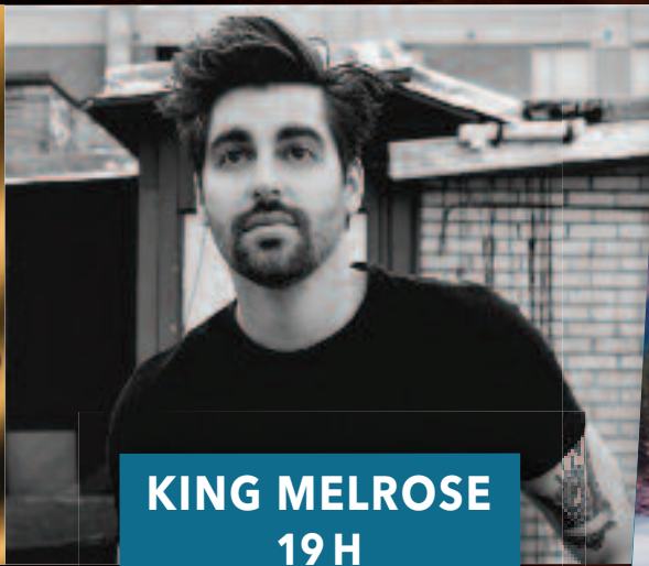
KING MELROSE 19 H