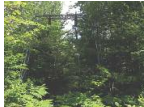
Structure ancienne de remonte-pente du Mont-Tyrol, encore présente au Centre de plein air Roger-Cabana.

La richesse de ce patrimoine ne se trouve pas dans une certaine valeur monétaire des objets ou des photos, mais dans les récits et souvenirs qu'ils font naître et renaître chez tous. Pour ces objets, le simple fait d'être anciens ou rares ne contribue pas seulement une certaine valeur monétaire. Leur véritable valeur est leur « pouvoir d'évocation et de récit » par l'identification des personnes, des objets et surtout des rôles joués par ceux-ci dans la famille ou la société. Transmettre les richesses du patrimoine c'est donc de prendre le temps de raconter le passé et, surtout de l'écrire avec ses « nuances de vie ».