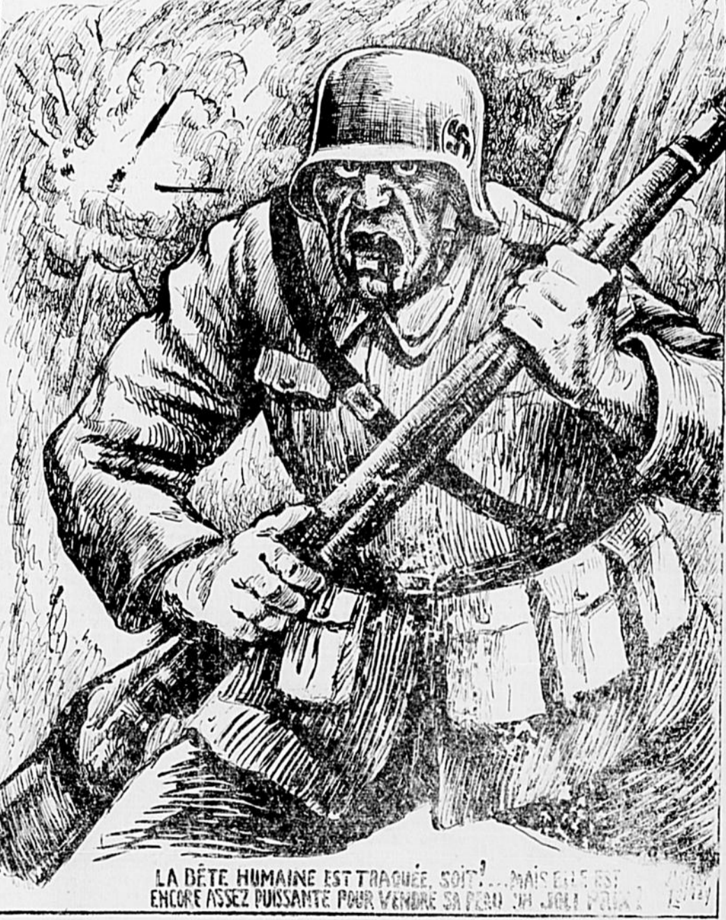
LA DÉTE HUMAINE EST TRAQUÉE, SOIT? MAIS ELLE EST ENCORE ASSEZ PUISSANTE POUR VENDRE SA PEAU UN JOUR! (1944)