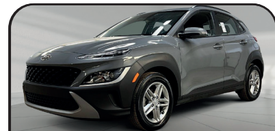
KONA ESSENTIEL 2022

SUR VÉHICULES SÉLECTIONNÉS DE L'ANNÉE MODÈLE 2022, 2023, 2024, 2025