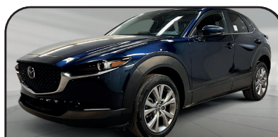
CX-30 GS 4RM 2021