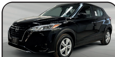
KICKS S 2024