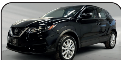
QASHQAI S 4RM 2023