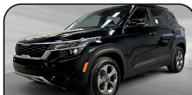
SELTOS LX 2022