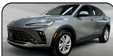
ENVISTA PREFERRED 2024