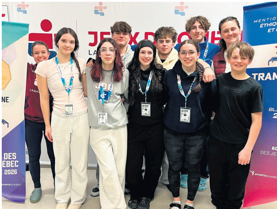
Les athlètes de trampoline de la délégation de Lanaudière posent avec leurs bannières.