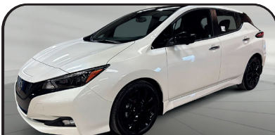
LEAF SV NAV 2023