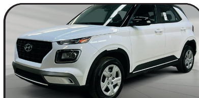
VENUE ESSENTIEL 2022