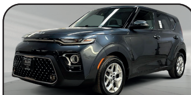
SOUL EX 2022