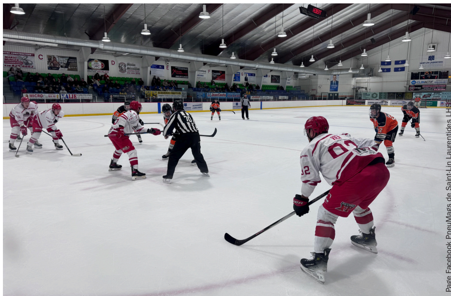
Les PneuMags disputaient leur première saison dans la LHSE.

Le propriétaire raconte que dimanche, son équipe était déjà à la limite légale du