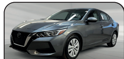
SENTRA S PLUS 2023