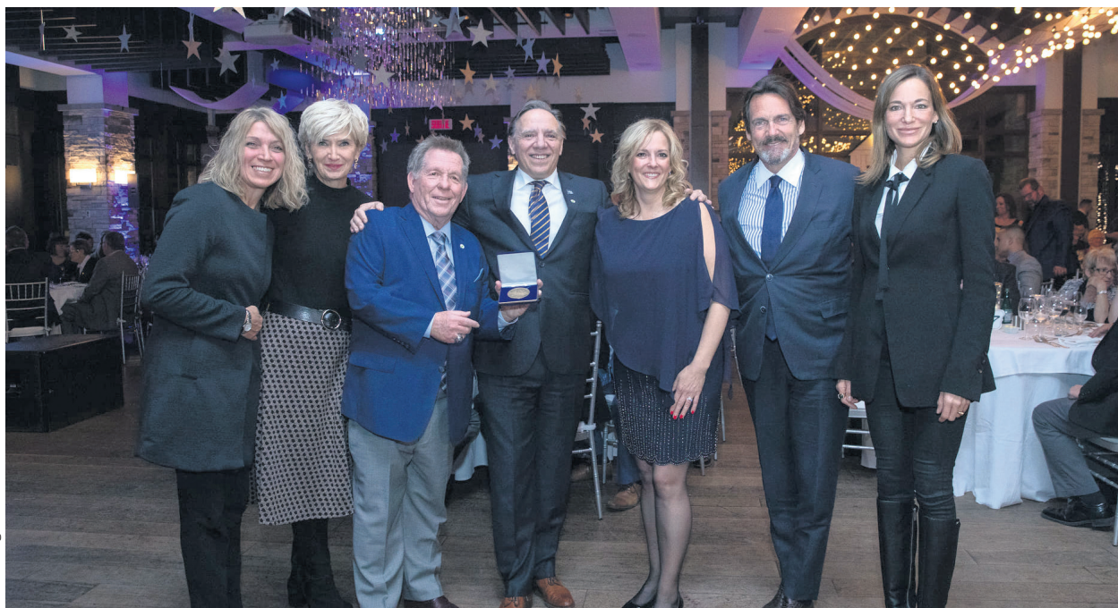
Rodger Brulotte avait reçu la médaille de l'Assemblée nationale en 2019 des mains de François Legault.