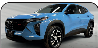
TRAX IRS 2024