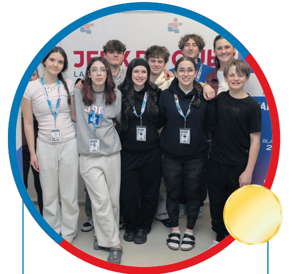
Équipe Régional TRAMPOLINE OR

Le Mascouchois a obtenu une médaille d'argent à l'épreuve individuelle en trampoline lors de cette compétition relevée. Il a terminé avec un score de 75 points, livrant une performance solide du début à la fin. Les régions de Mauricie et de Richelieu-Yamaska complètent le podium dans sa catégorie respective.