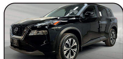
ROGUE SV TOIT PANO 4RM 2023