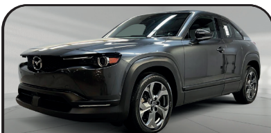
MX-30 GT TOIT NAV 2022