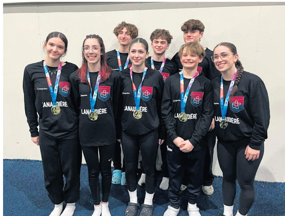
Les athlètes de trampoline de la délégation de Lanaudière pour les Jeux du Québec de Blainville 2026.