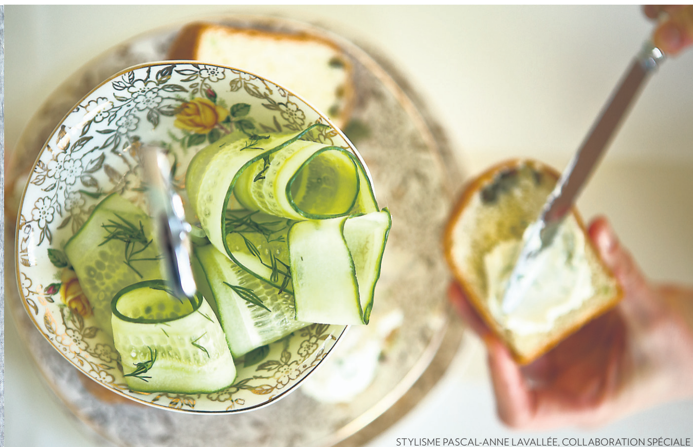
STYLISME PASCAL-ANNE LAVALLÉE, COLLABORATION SPÉCIALE