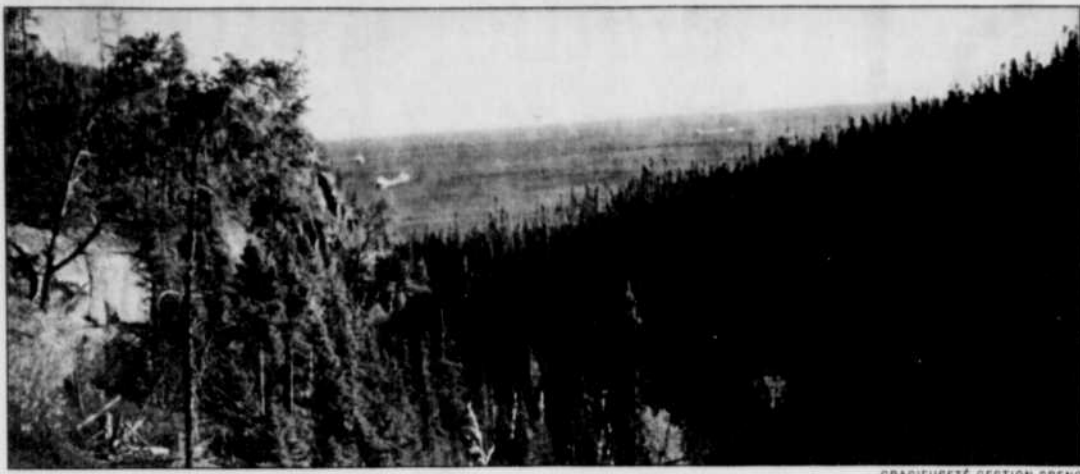
Une partie du magnifique territoire convoité par les promoteurs touristiques.