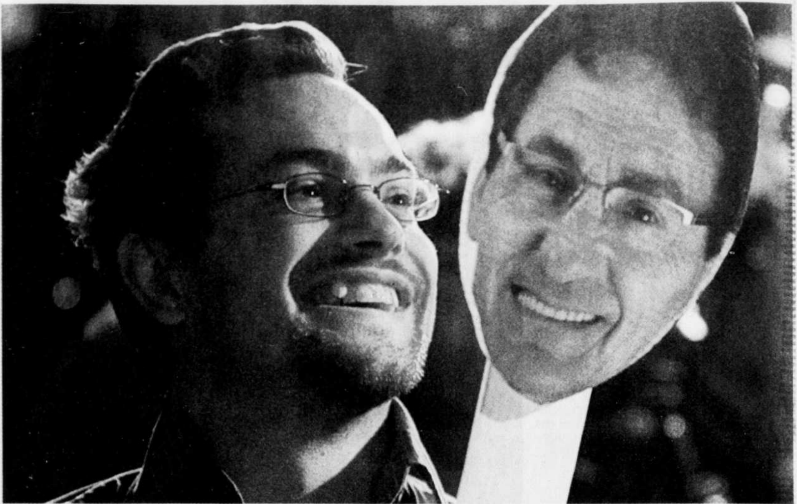
Rassemblés au théâtre Le National, des dizaines de candidats et de partisans de Projet Montréal attendaient avec fébrilité les résultats électoraux, dévoilés au compte-gouttes et projetés sur des écrans géants.