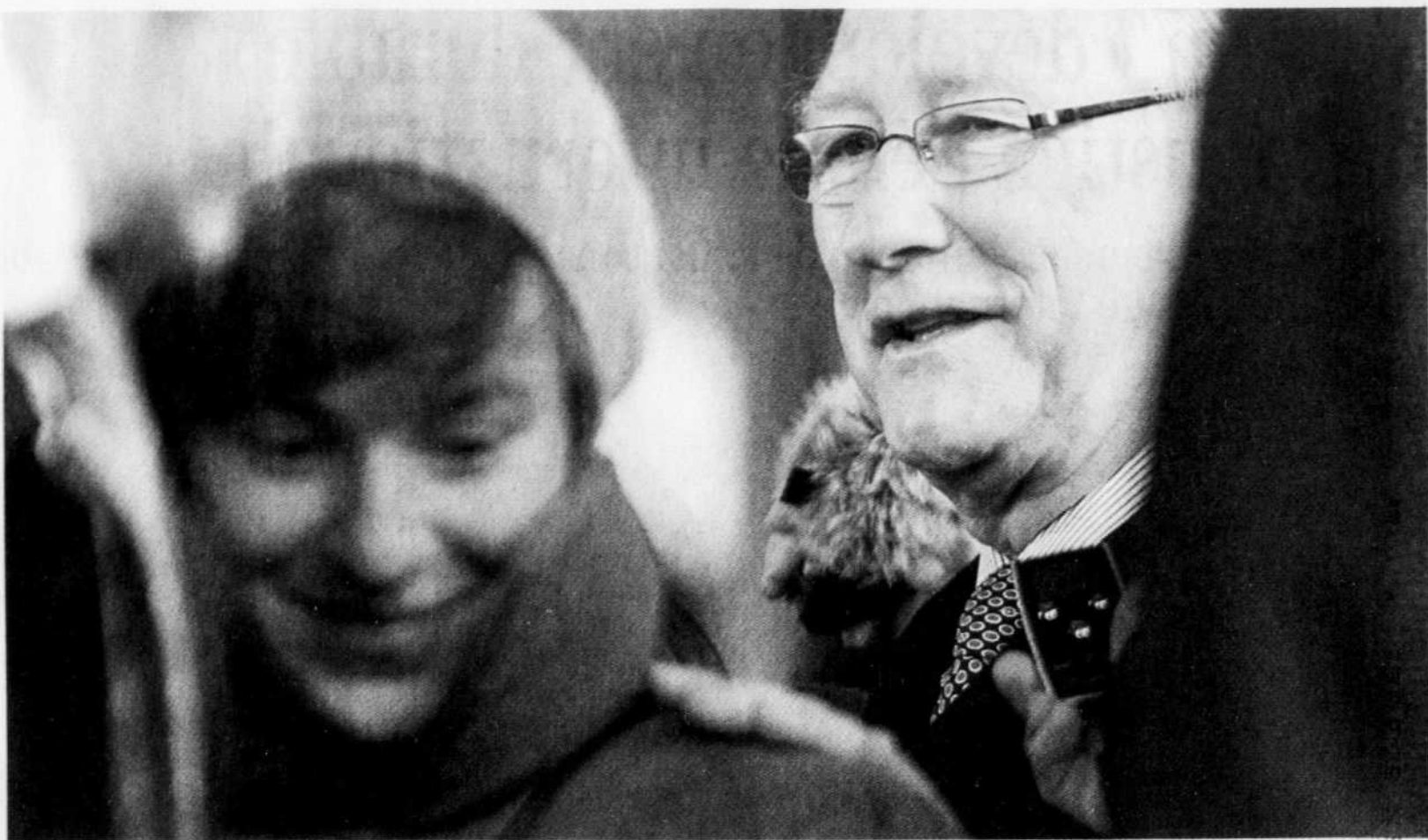
Le maire Gérald Tremblay photographié hier après-midi pendant que les électeurs faisaient leur choix.