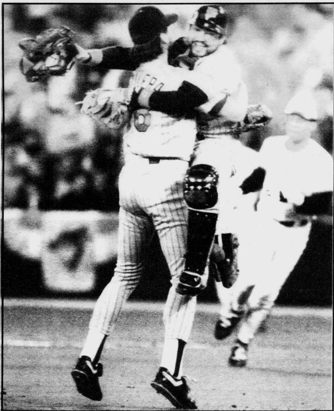
Le receveur Junior Ortiz saute dans les bras du releveur Rick Aguilera au moment où les Twins viennent de remporter une victoire de 8-5 pour éliminer les Blue Jays de Toronto en finale de championnat de la Ligue américaine.

«Quand tu dois grimper dans un arbre et ensuite plonger dans l'eau, c'est que les choses ne vont pas bien», a-t-il commenté avant de partir.