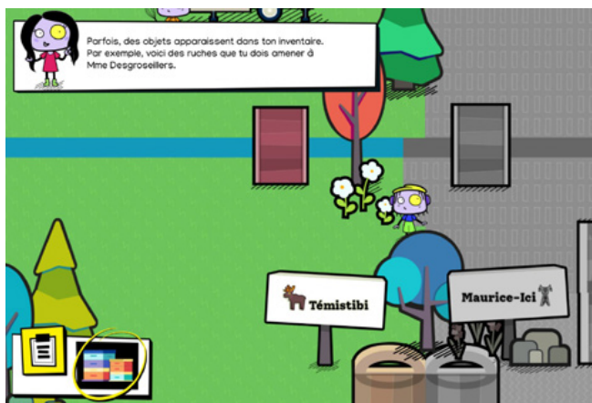
Capture écran du jeu Kasscroust

L'application Mangeons local plus que jamais! peut être téléchargée sur Google Play ou l'App Store, mais il est également possible de consulter le site Web .