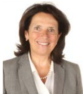
Marie Cinq-Mars Mairesse de l'arrondissement d'Outremont

Le centre communautaire intergénérationnel - mieux connu par son sigle, CCI - est le centre névralgique d'Outremont pour les sports et les loisirs. L'arrondissement continue d'y investir et procèdera bientôt à l'aménagement d'une nouvelle entrée qui donnera directement sur le stationnement afin de faciliter l'accès de l'aréna et du CCI aux utilisateurs.