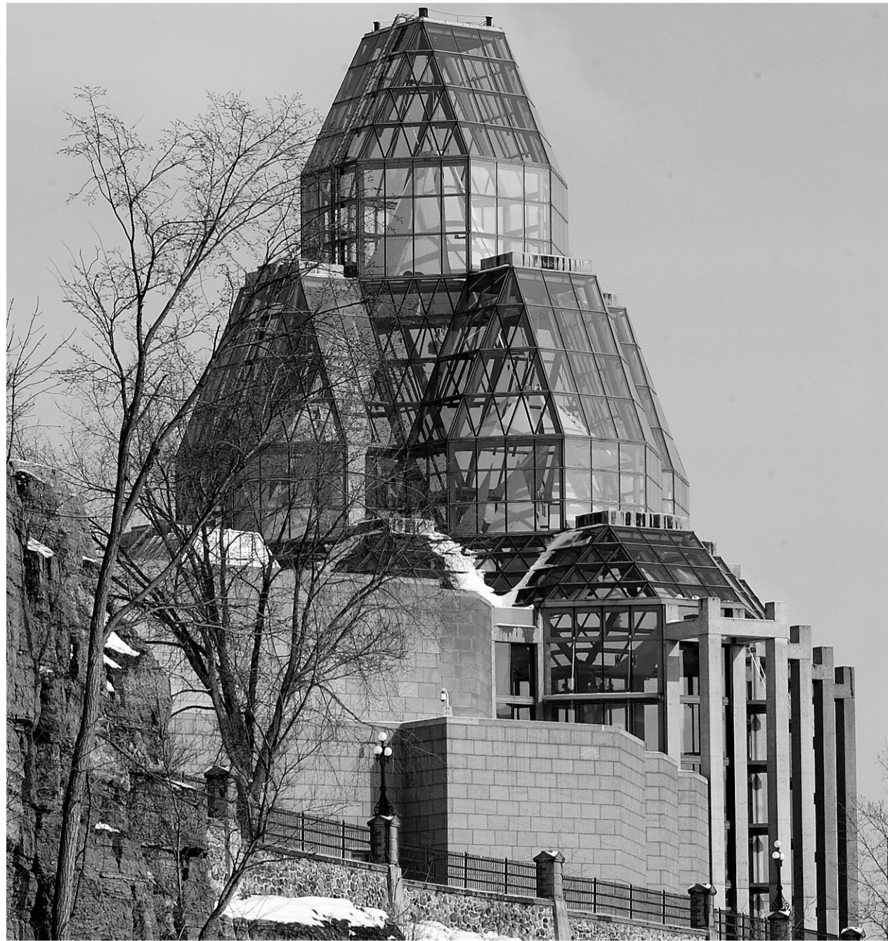
Le Musée des beaux-arts du Canada a goûté à la médecine du gouvernement conservateur l'an dernier. L'examen du MBAC s'est soldé par des compressions de 2,5 millions de dollars.

«Comme membre du conseil d'administration, soutient-il, ma première responsabilité est de