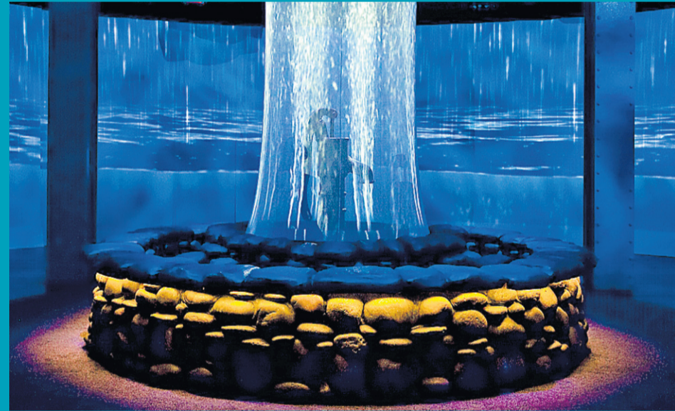
Aqua , la nouvelle exposition du Centre des sciences dans le Vieux-Port de Montréal, est une expérience multisensorielle issue de la Fondation One Drop de Guy Laliberté. L'installation est constituée d'un puits central et d'un écran de 360 degrés permettant la participation des spectateurs.