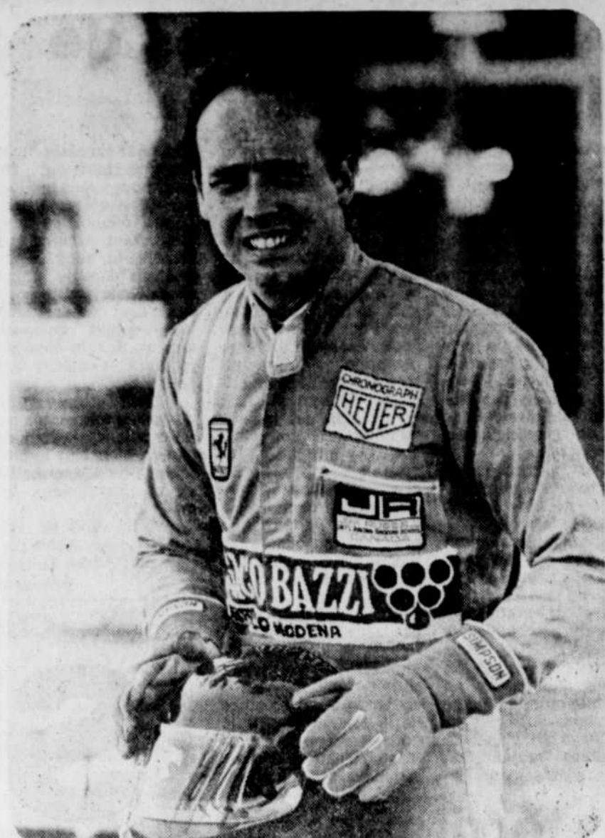
Le Soleil, J.-M. Villeneuve

Selon l'horaire du long week-end de compétition automobile sur le circuit rebaptisé "Gilles Villeneuve" en hommage posthume au coureur québécois, les premiers essais chronométrés de Formule Un seront entamés demain à 13h. Quant à la course du Grand Prix canadien, le départ sera donné à 14h15 dimanche.