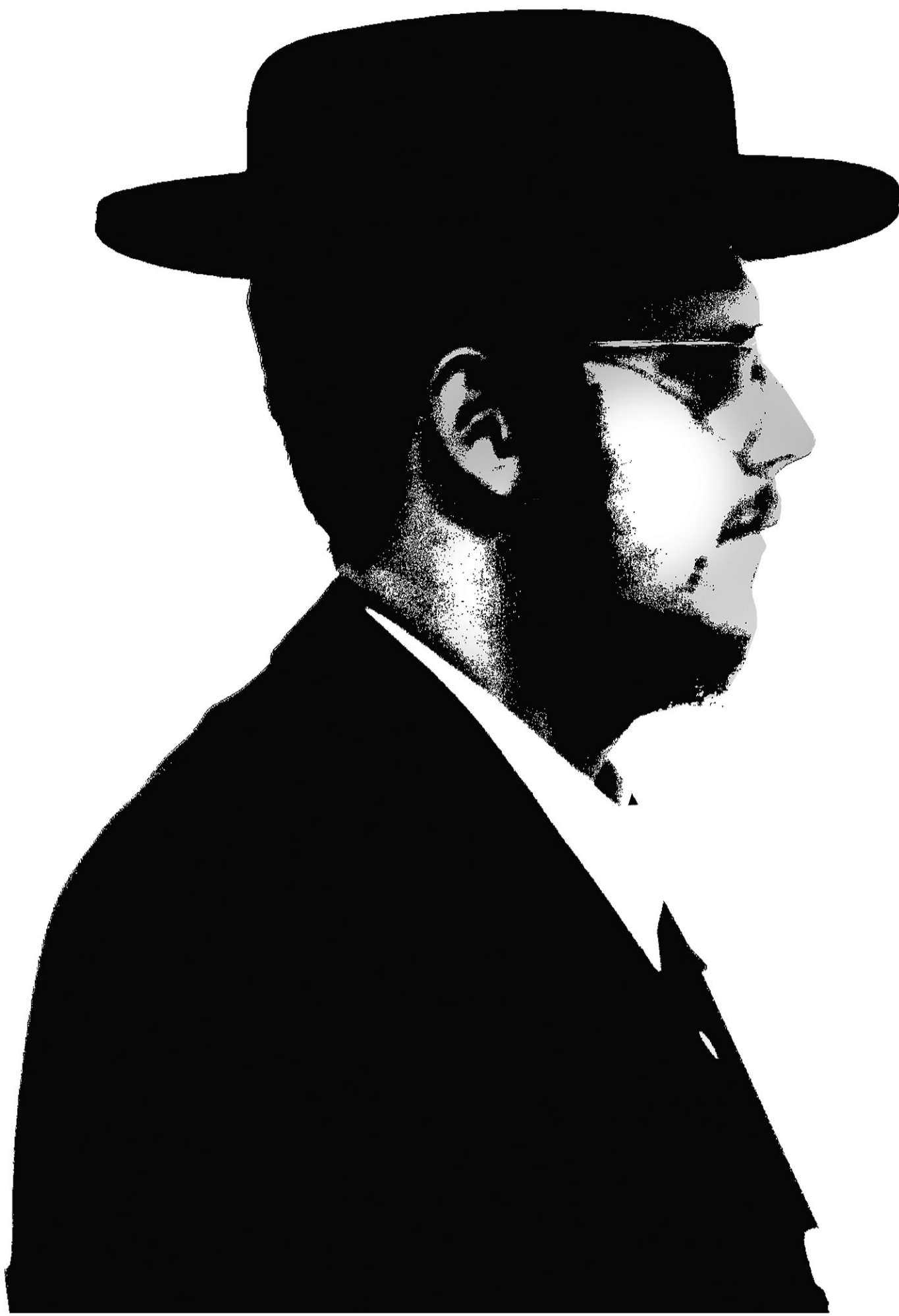
PHOTO MARTIN TREMBLAY. ILLUSTRATIONS ANDRÉ RIVEST, PHILIPPE TARDIF, LA PRESSE ©