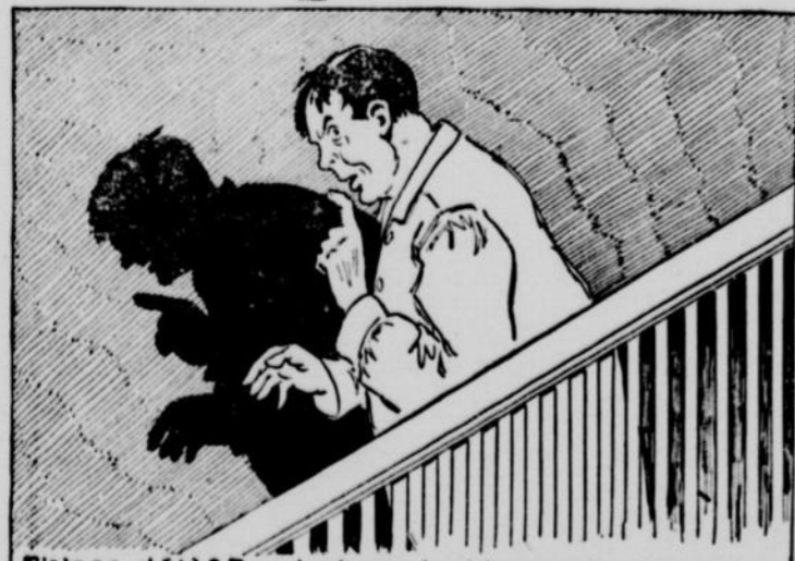
T'a pas déjà? Pendant que tout le monde dormait -