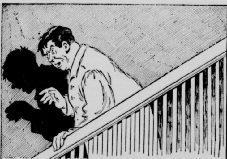
descendu sur le bout du pied dans la cuisine