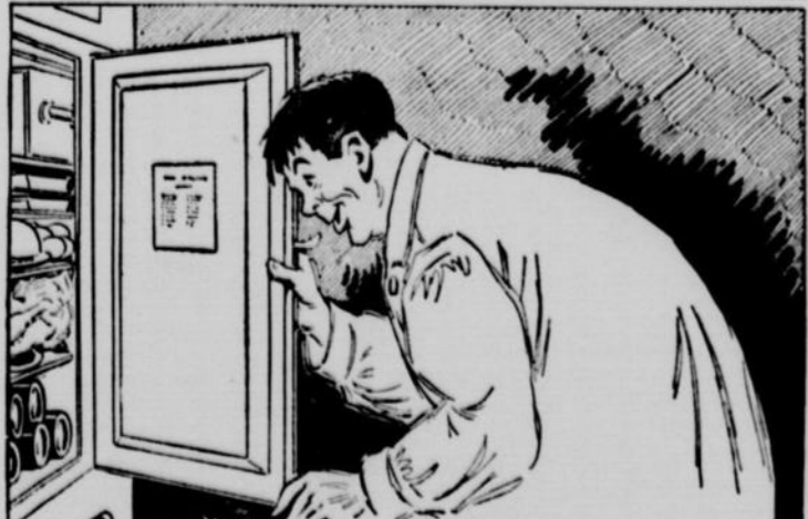
et piqué droit sur le réfrigérateur, à la recherche d'un sandwich et d'un verre de BLACK HORSE?