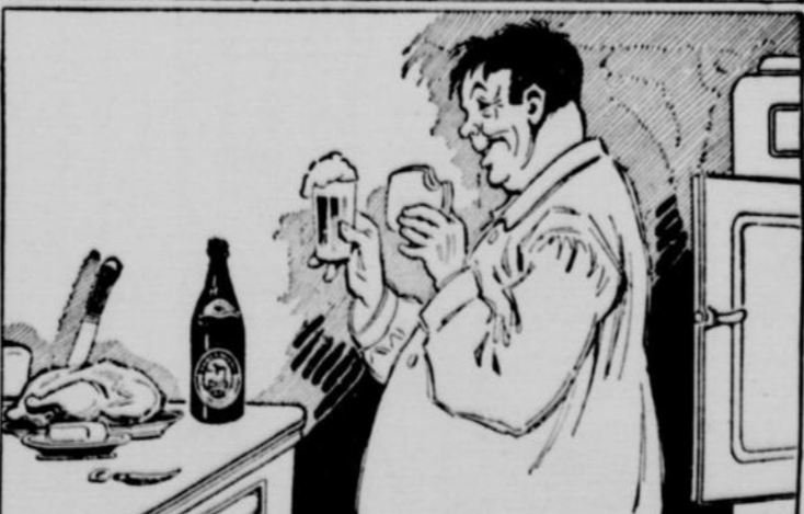
Ya pas à dire, comme régal - c'est tapé!