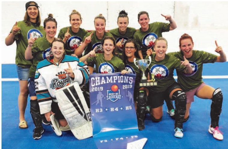
L'équipe féminine de hockey-balle de Bagotville a remporté la saison régulière de la ligue civile du Saguenay.