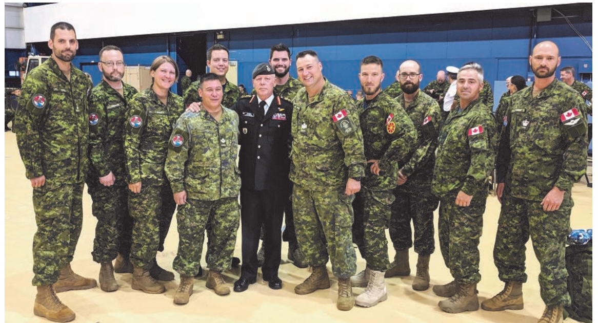
Les membres de l'équipe de militaires de la 2 e Escadre, qui ont pris part à la marche Nimègue 2019, posent ici en compagnie du chef d'État-Major de la Défense du Canada, le général Jonathan Vance.

Profitant de l'occasion de leur présence en Europe, les membres du contingent militaire canadien ont tenu des cérémonies commémoratives devant le monument à la bataille de la Crête de Vimy en France, puis dans les cimetières militaires canadiens de Bergen op Zoom et de Groesbeek aux Pays-Bas. Les marcheurs ont aussi eu la chance de participer à des visites culturelles dans des musées retraçant l'histoire de la libération de la Hollande par les troupes canadiennes lors de la Seconde