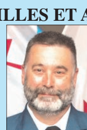
Adj Rlvard CD2