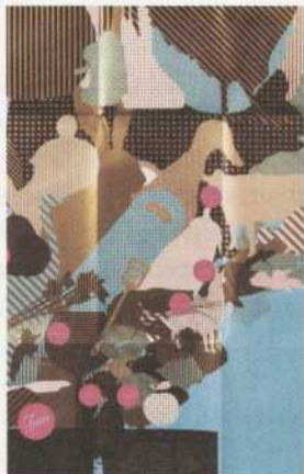
PRIX COUPE INTERNATIONAL DESIGN AND IMAGE AWARDS ANNUAL (2008) et le prix Design événementiel Grafika 2009.

COUP DE CHAPEAU À IDENTICA! Depuis plusieurs années, l'équipe de branding et design Identica du Monde de Cossette conçoit l'image et le matériel promotionnel de notre super gastronomique sur scène. Pour Cena Olé (2007) et Cena d'chez nous (2008), elle a été récompensée lors de prestigieux concours nationaux et internationaux.