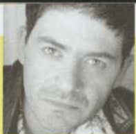
Wajdi Mouawad.