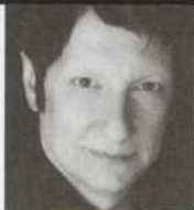
Robert Lepage