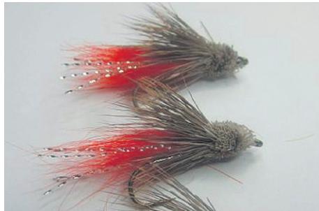
Une mouche muddler plombée (jig-mouche) de 1/16e d'once.

Riche de ses 39 ans d'expérience en montage de mouches à pêche, ce Chandlerois affirme que la couleur orange brûlée est sans doute celle qui permet les meilleurs succès de pêche à la grosse truite et autres salmonidés. D'ailleurs, cette autre mouche muddler fabriquée avec un petit filament de cristal (photo) a permis à ce jour des captures de truites record aux quatre coins du Québec, selon les dires de M. Blais. (C.L.)