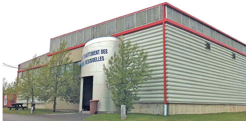
L'année 2014 est caractérisée par une diminution de 5 % en provenance du secteur résidentiel, mais d'une augmentation de 33 % du secteur industriel et commercial ainsi que d'un apport supplémentaire de l'industrie de la transformation des produits marins.

«Il vérifie également les bacs au chemin et identifie les résidences qui ne compostent pas, par exemple.» (T.H.)