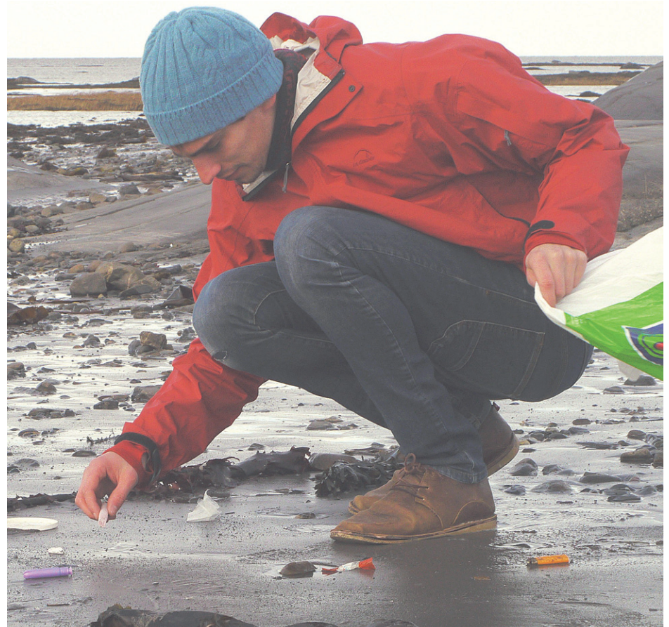
Toute la communauté est invitée à effectuer ce grand nettoyage le 20 juin prochain à Chandler et Pabos.

En cas de pluie le 20 juin, le nettoyage est remis au lendemain à la même heure. Les participants sont invités à s'inscrire sur la page Facebook de l'événement : « Grand nettoyage du 20 juin » ( https://www.facebook.com/events/1620495584862138/ ).