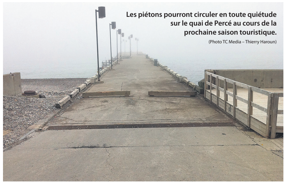
Les piétons pourront circuler en toute quiétude sur le quai de Percé au cours de la prochaine saison touristique.

Toutes ces recommandations découlent des rapports produits au cours des dernières années par la firme CIMA+ pour le compte du MPO qui constataient entre autres des «vides importants sous la dalle, particulièrement à l'accès du quai. On a fait des travaux temporaires en procédant à l'injection de béton de sorte que la dalle repose sur du solide. À certains endroits, il pouvait y avoir un mètre de vide», ajoute M. Beaudoin. Ce dernier précise toutefois que non seulement l'infrastructure a atteint la fin de sa vie utile, mais que des travaux de réparation importants ne pourraient pas y être faits parce que la structure ne pourrait «pas supporter le poids de la machinerie nécessaire pour y faire des travaux.»