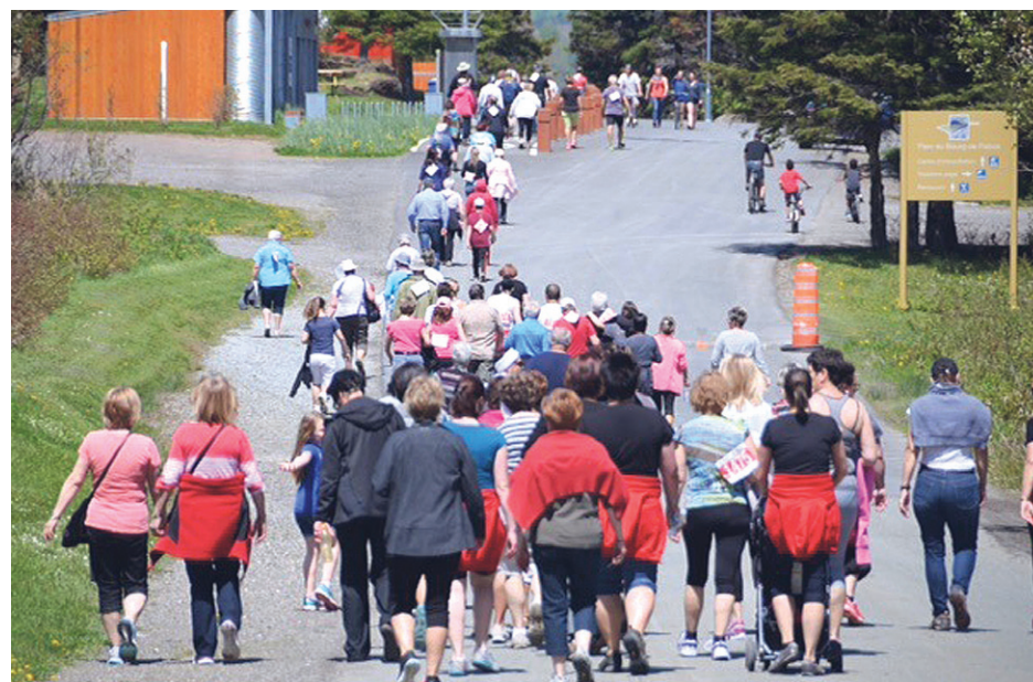
Plus de 150 personnes ont marché pour une bonne cause, soit celle du Fonds Michel-Lancup.

Chose certaine, la marche reviendra pour une quatrième édition l'an prochain, soit le 1er juillet 2016. Une date qui pourrait devenir fixe pour les années à venir fait valoir, Luc Legresley. «C'est une date qui est facile à retenir et c'est une journée de congé puisque c'est la Fête du Canada.»