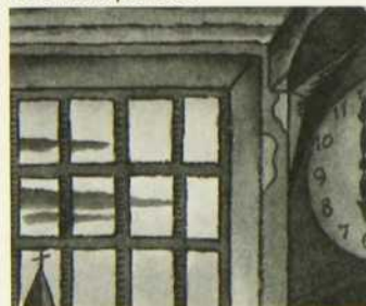
Le Diable partout

La trame sonore de cette émission est d'André Gagnon et de Pierre F. Brault.