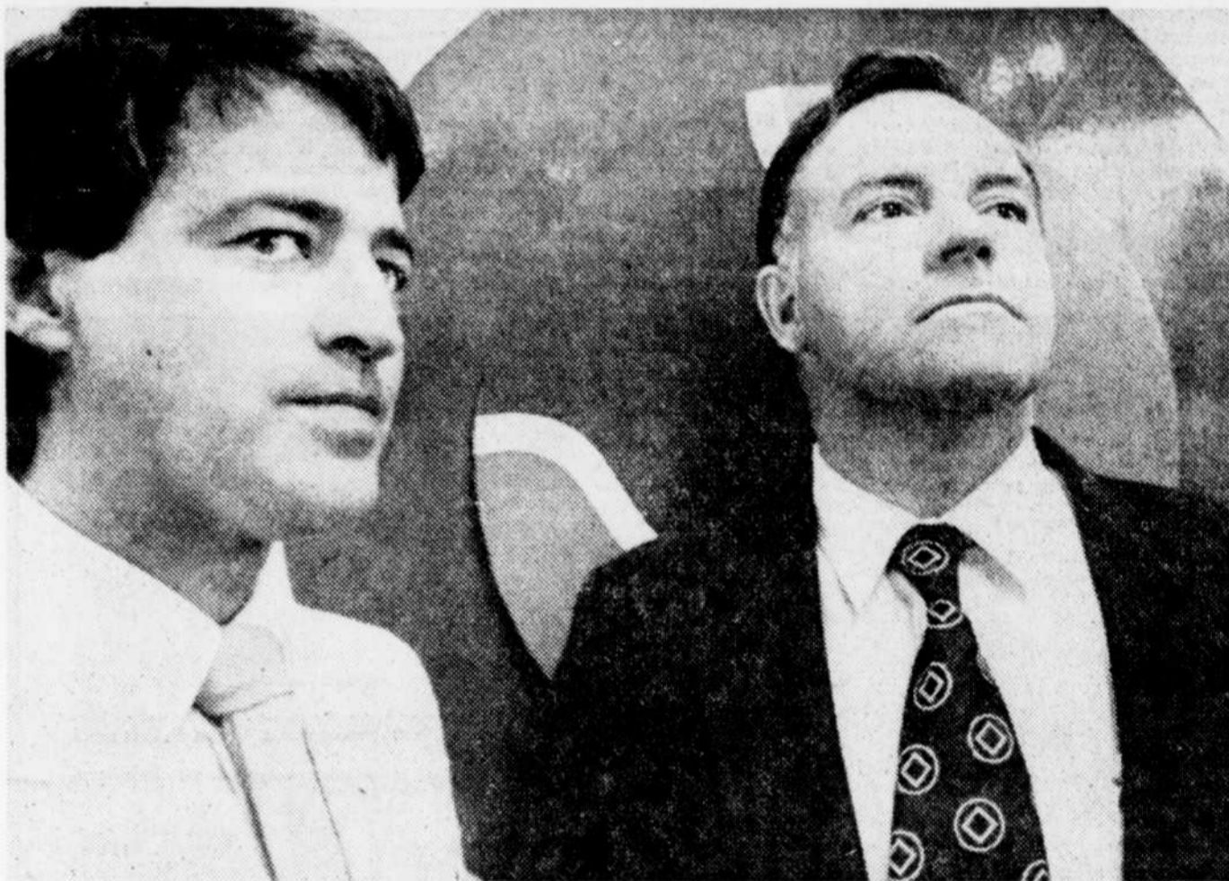
L'entraîneur chef d'Equipe-Canada, Scotty Bowman, a promis de demander quelques conseils à son homologue chez les Nordiques, Michel Bergeron, en vue du tournoi Coupe Canada.