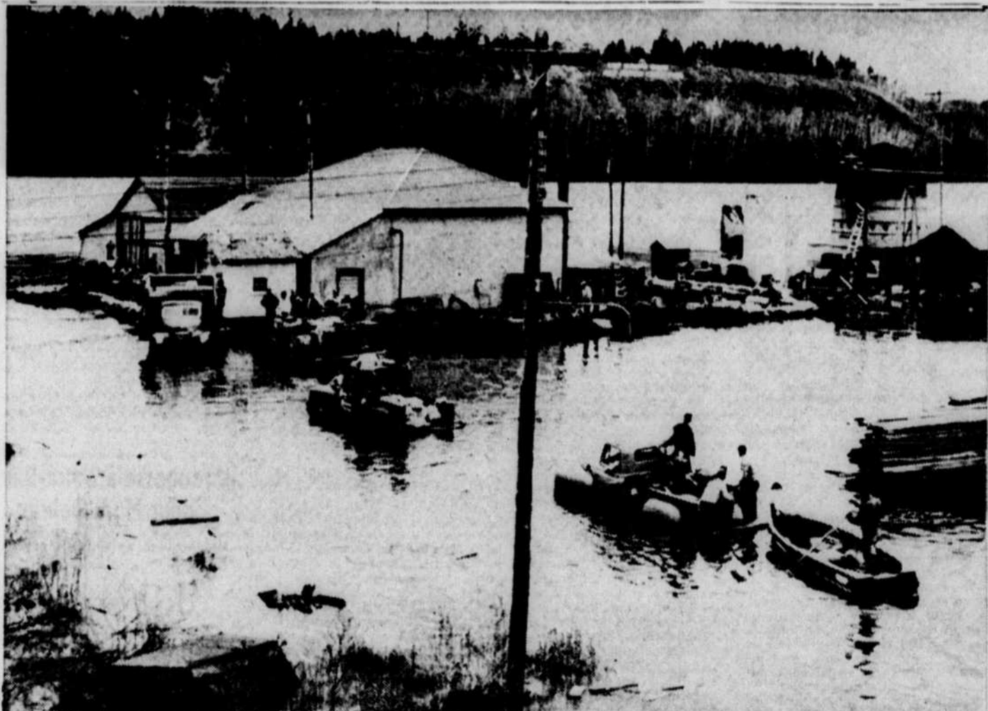
Gens de la ville et gens de la campagne sont accourus récemment au secours des pouvoirs hydrauliques et électriques établis en bordure de la ville d'Atabasca. Cette petite ville, située à 100 milles au nord d'Edmonton, en Alberta, a vu ses ressources en électricité grandement menacées par la crue des pluies. 400 fermiers et citoyens ont rempli des camionnettes et des barques de sacs de sable. Ils ont travaillé durant 24 heures afin de former un barrage efficace. Une semaine de pluies abondantes dans le nord de l'Alberta a repoussé sur les rives de la rivière Athabasca 5,000,000 de pieds de bois de pulpe.

On repêche le corps d'un noyé dans le port