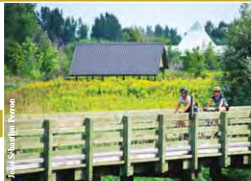
Jean Sébastien Perron

De plus, pour les kayakistes et canoteurs un peu plus chevronnés, nous vous invitons à faire une pause ou un pique-nique à une des quatre haltes nouvellement aménagées sur la rive ouest de l'île Grosbois.