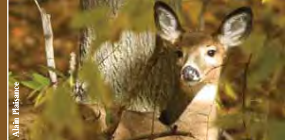
CERF DE VIRGINIE

Non. Les prédateurs naturels du cerf sont les loups et les cougars. Les lynx et les ours peuvent aussi s'attaquer aux faons. Ces animaux sont absents de notre territoire. Cependant, les coyotes sont arrivés aux îles, il y a peu de temps, mais