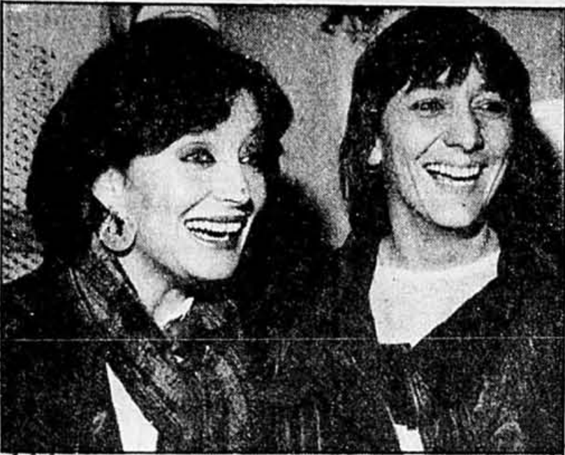
Louise Marleau et Léa Pool