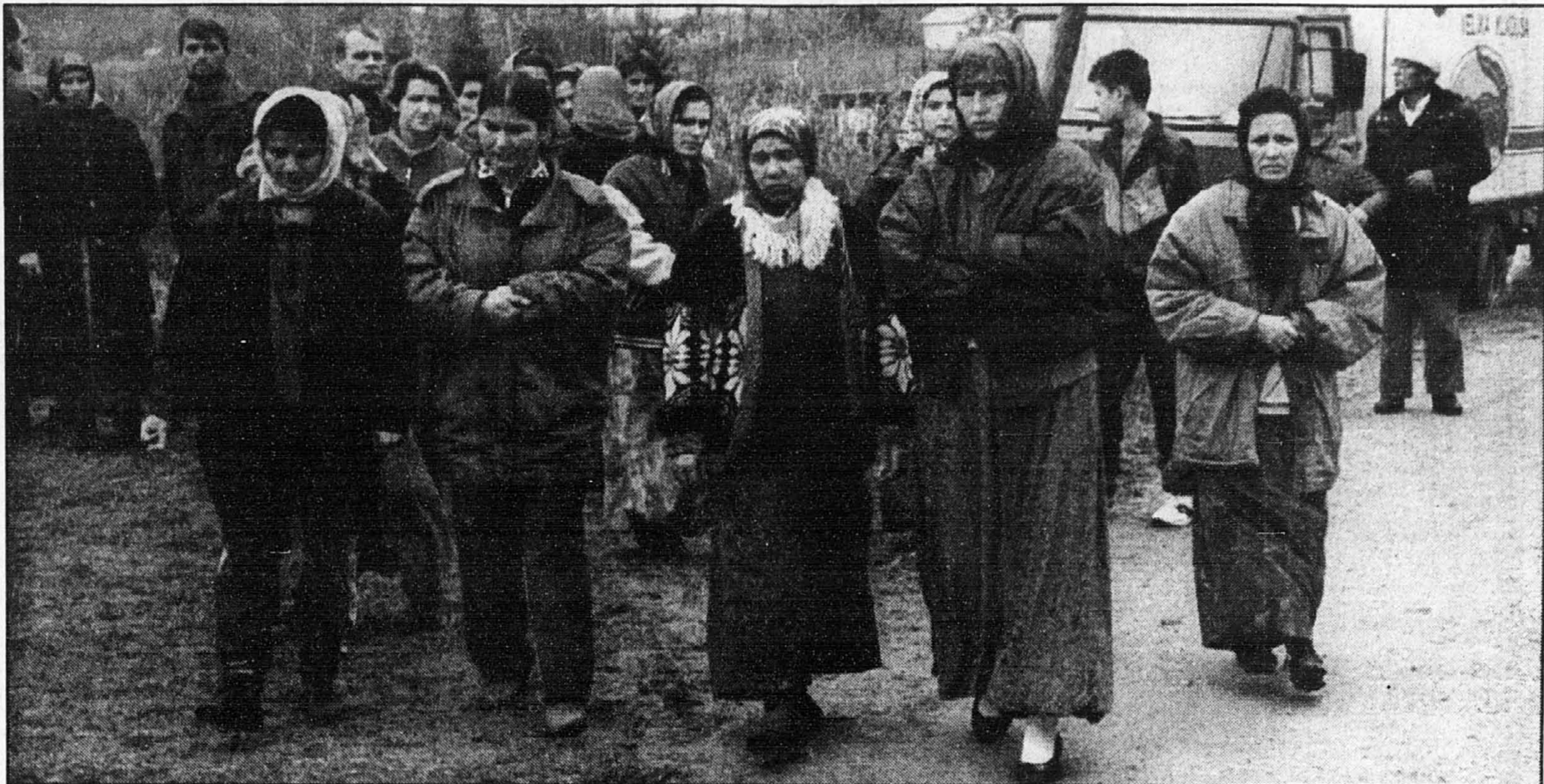
Des musulmanes bosniaques attendaient mardi, à l'extérieur de Velika Kladusa, en espérant pouvoir regagner leurs maisons. Quelque 30 000 personnes ont fui la région après que les troupes gouvernementales eurent défait celles du leader musulman rebelle Fikret Abdic.

Les élections législatives et présidentielle ont débuté hier matin en Namibie, où les observateurs s'attendent à ce que la SWAPO, au pouvoir depuis l'indépendance, il y a quatre ans, sorte renforcée du scrutin. Le président Sam Nujoma a été l'un des premiers à voter à Windhoek à l'ouverture des bureaux de vote, à 7 h locales. « Nous avons enfin enterré l'apartheid ; nous devons enterrer la pauvreté, la faim, la maladie et l'ignorance avec la vigueur avec laquelle nous avons enterré le colonialisme et l'apartheid », a-t-il dit. d'après Reuter