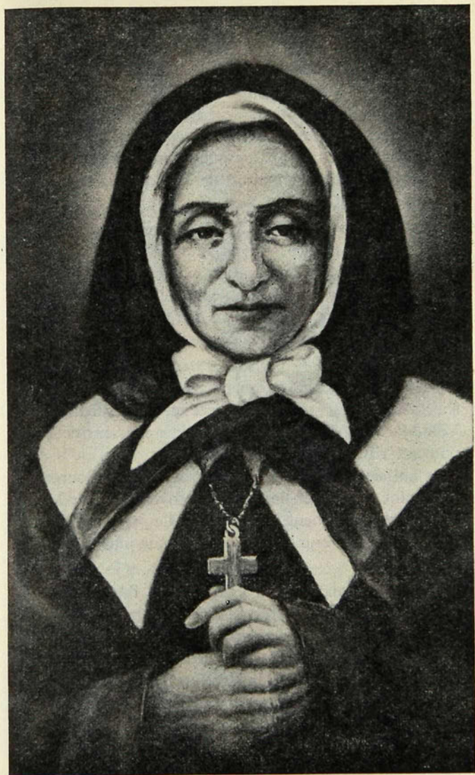
La bienheureuse Marguerite Bourgeoys