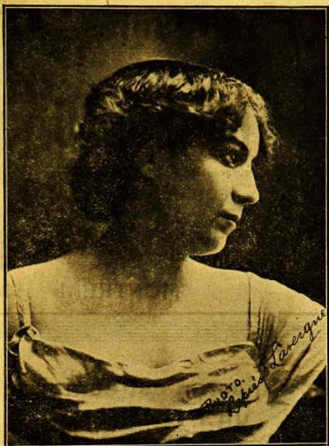
Photographie LAPRÈS &amp; LAVERGNE, 360, Rue St-Denis