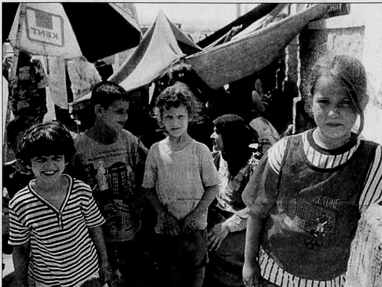
Ces jeunes réfugiés palestiniens se lancent dans un sit-in et une grève de la faim à Beyrouth afin de protester contre les compressions dans les services sociaux, l'éducation et la santé réalisées à l'Office de secours et de travaux des Nations unies pour les réfugiés de Palestine dans le Proche-Orient. Cette agence, située tout près, a en effet décidé de réduire les services offerts aux réfugiés.