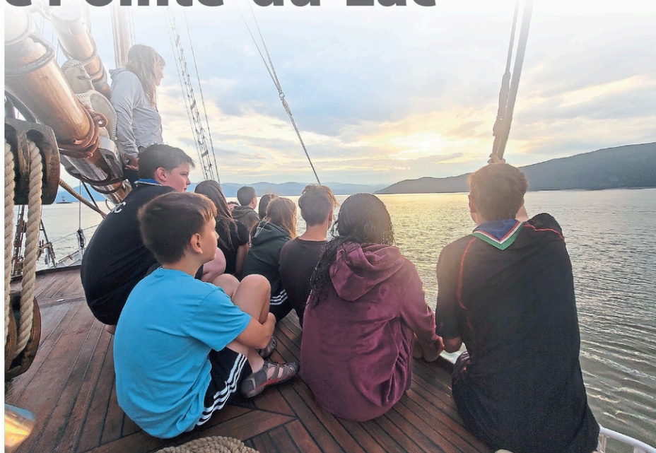
Des scouts de Pointe-du-Lac ont navigué sur le fleuve Saint-Laurent à bord d'un voilier.

Dame Nature a été clémente tout au long de l'expédition. Le beau temps était au rendez-vous pratiquement tous les jours. Le groupe a fait une escale à Québec, puis a repris la direction de Tadoussac. Une fois arrivé dans la baie de Tadoussac, le groupe a pu observer les baleines. Après un court séjour sur la terre ferme, la troupe