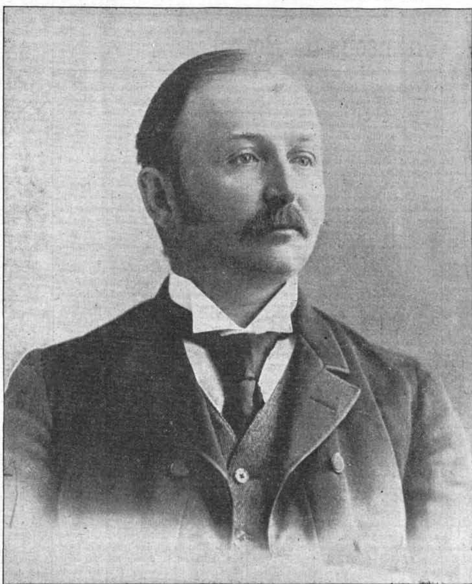
l'Honorable S.-N. Parent

$2.05 ✨ Valeur des morceaux de musique contenus dans le présent numéro ✨ $2.05 Voir la liste de Nos Primes à la page 55. ➡