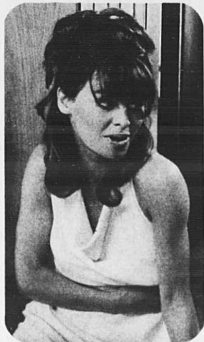
Julie Christie dans "Petulia"