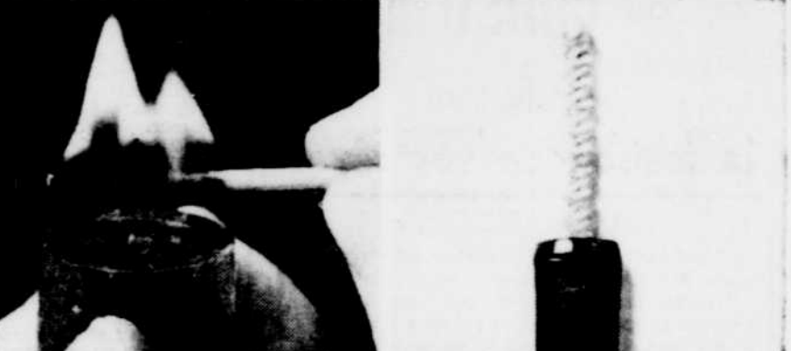
Bourrez votre pipe par petites quantités, laissez le tabac chaque fois. (Assurez-vous que la pipe tire bien avant de l'allumer.)