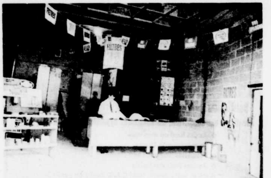
Ci-dessus nous apercevons le département des pièces de J.-M. Lambert Auto Inc. C'est là que vous trouverez sûrement satisfaction lorsqu'il s'agira de service de pièces à votre auto qu'elle soit neuve ou usagée. Des experts vous fourniront exactement ce dont vous avez besoin en quelques instants et vous êtes en plus assurés d'une qualité exceptionnelle.

Vous êtes assurés de trouver satisfaction en consultant notre maison lorsqu'il s'agit du choix de votre auto. Nous vous garantissons de trouver ce qui vous convient sur notre vaste terrain d'autos neuves et usagées. Nous faisons nous-même l'entretien et le service des voitures neuves que nous vendons.