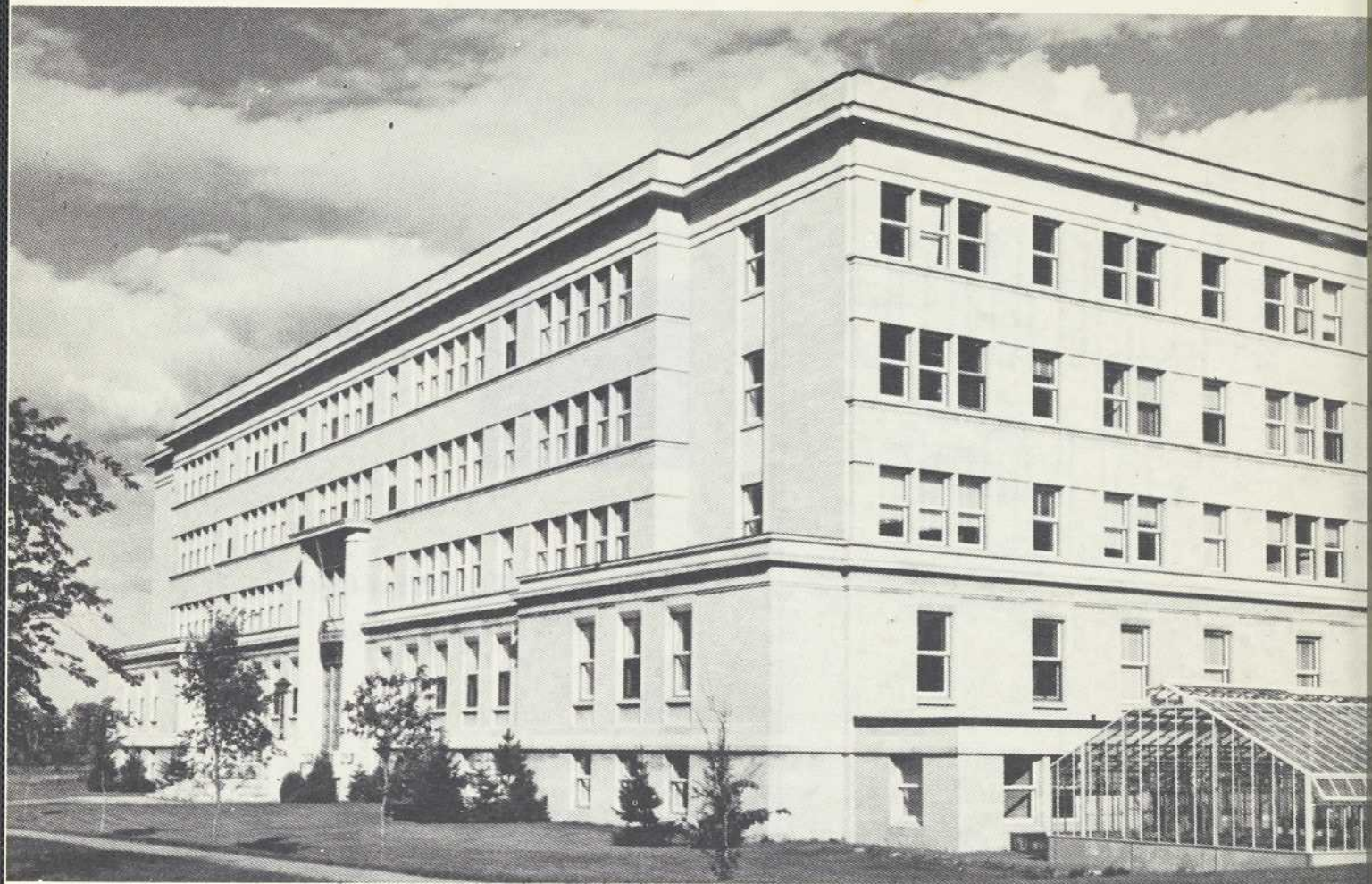
Le pavillon de la Faculté, premier immeuble érigé dans la cité universi- à Sainte-Foy, fut inauguré en novembre 1951.