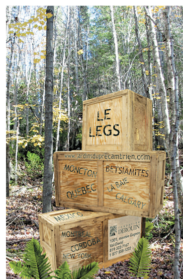
SOURCE SYMPOSIUM DE VAL-DAVID Détail de l'affiche du 11 e Symposium international d'art in situ de Val-David

Emmanuel Galland a aussi inclus des artistes moins