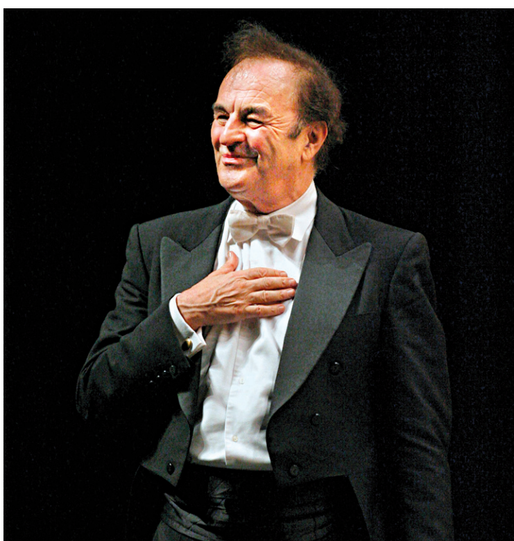
Charles Dutoit et l'Orchestre de Philadelphie sont les invités du Festival de Lanaudière les 22 et 23 juillet.