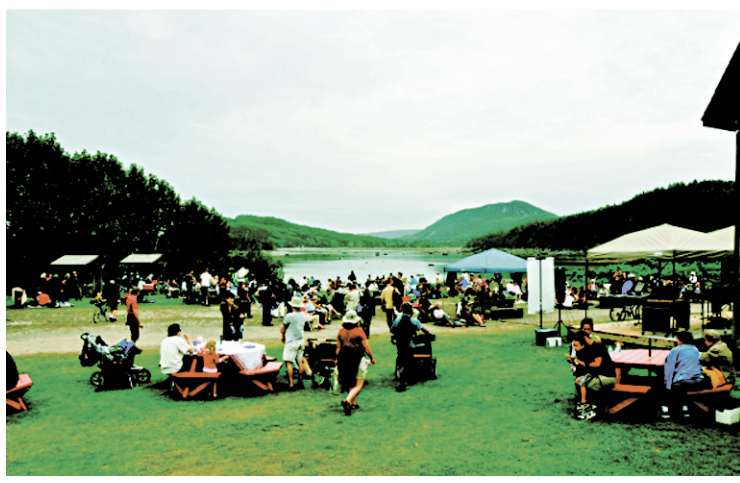
SOURCE CONCERTS AUX ÎLES DU BIC Le festival Concerts aux îles du Bic se tiendra du 5 au 14 août.

Le dimanche 7 août, les amateurs de musique classique seront invités à se diriger vers la chapelle de Saint-Fabien-sur-Mer pour une série de duos. «Cette chapelle idyllique est à l'origine du festival. Les fondateurs, Elise Lavoie et James Darling, avaient entendu parler de cette chapelle très intimiste en bordure du fleuve, ils s'y sont rendus et ils