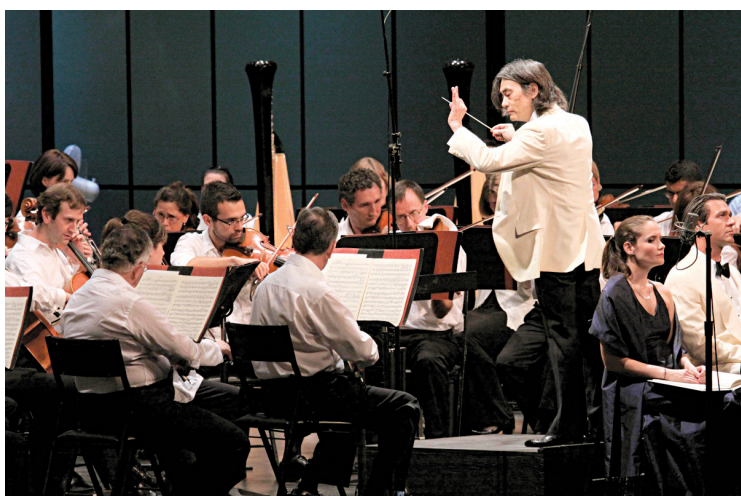
Kent Nagano dirigera l'OSM le 6 août prochain à Lanaudière.