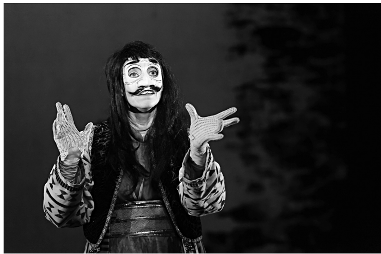
Une scène du Voyage de Pénazar, de la compagnie L'Entreprise

Les parrains de l'édition 2011 sont des artistes français, François Cervantes et Catherine Germain, fondateurs de la compagnie L'Entreprise, établie à Marseille. «Lorsqu'on leur a dit que nous étions dans un village perdu, avec des salles peu équipées, ils sont tombés sous le char-