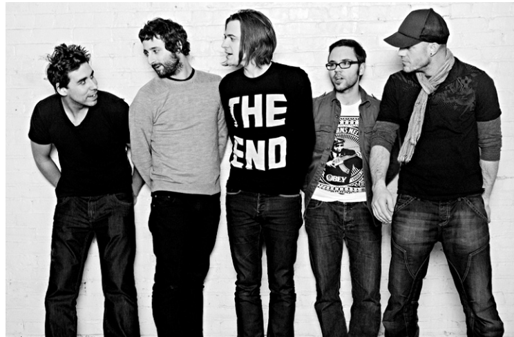
Le groupe Karkwa