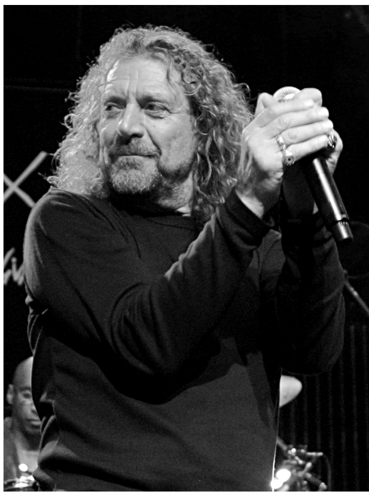
Robert Plant sera en préouverture du Festival de jazz de Montréal à la salle Wilfrid-Pelletier.