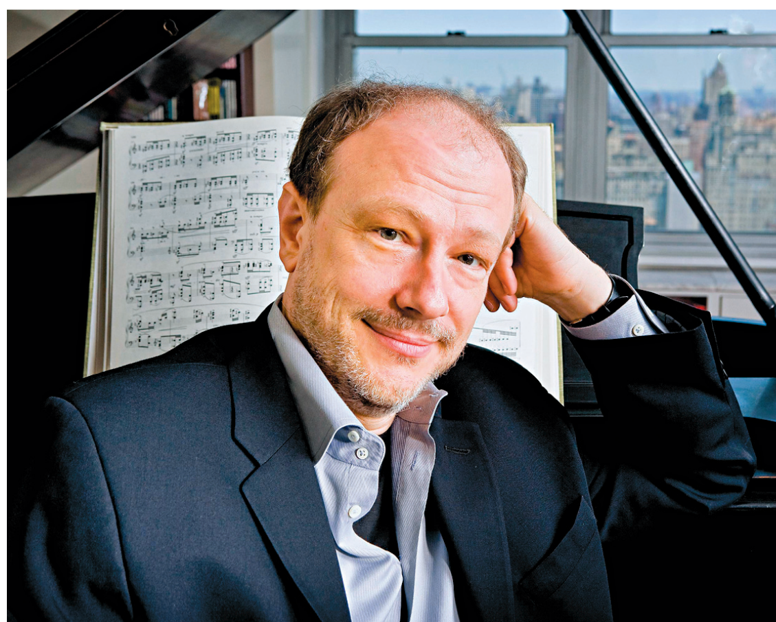
Marc-André Hamelin jouera la Sonate en si mineur , de Liszt, le 6 août au Domaine Forget.