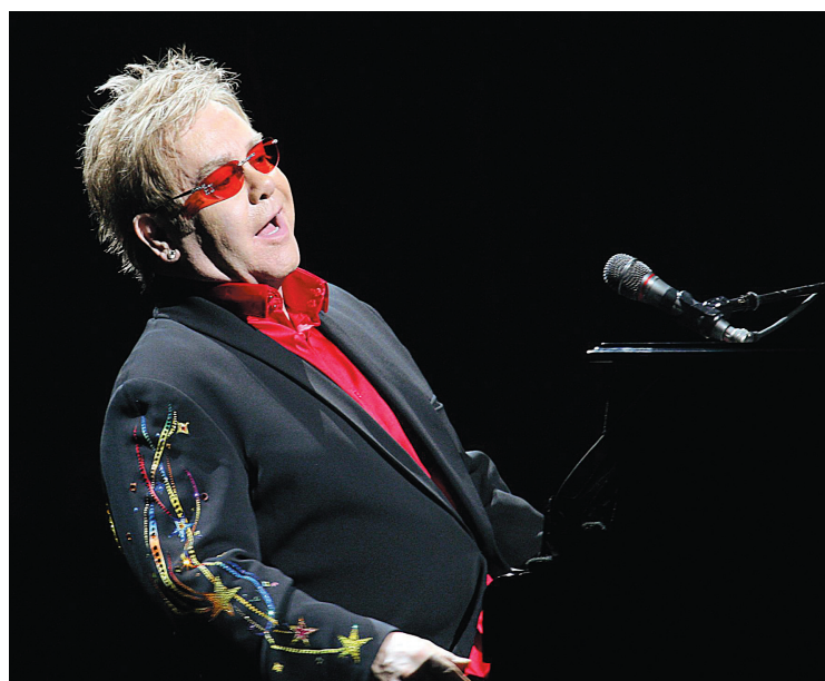
JACQUES GRENIER LE DEVOIR

Aspen Santa Fe Ballet pour le Festival des arts de Saint-Sauveur