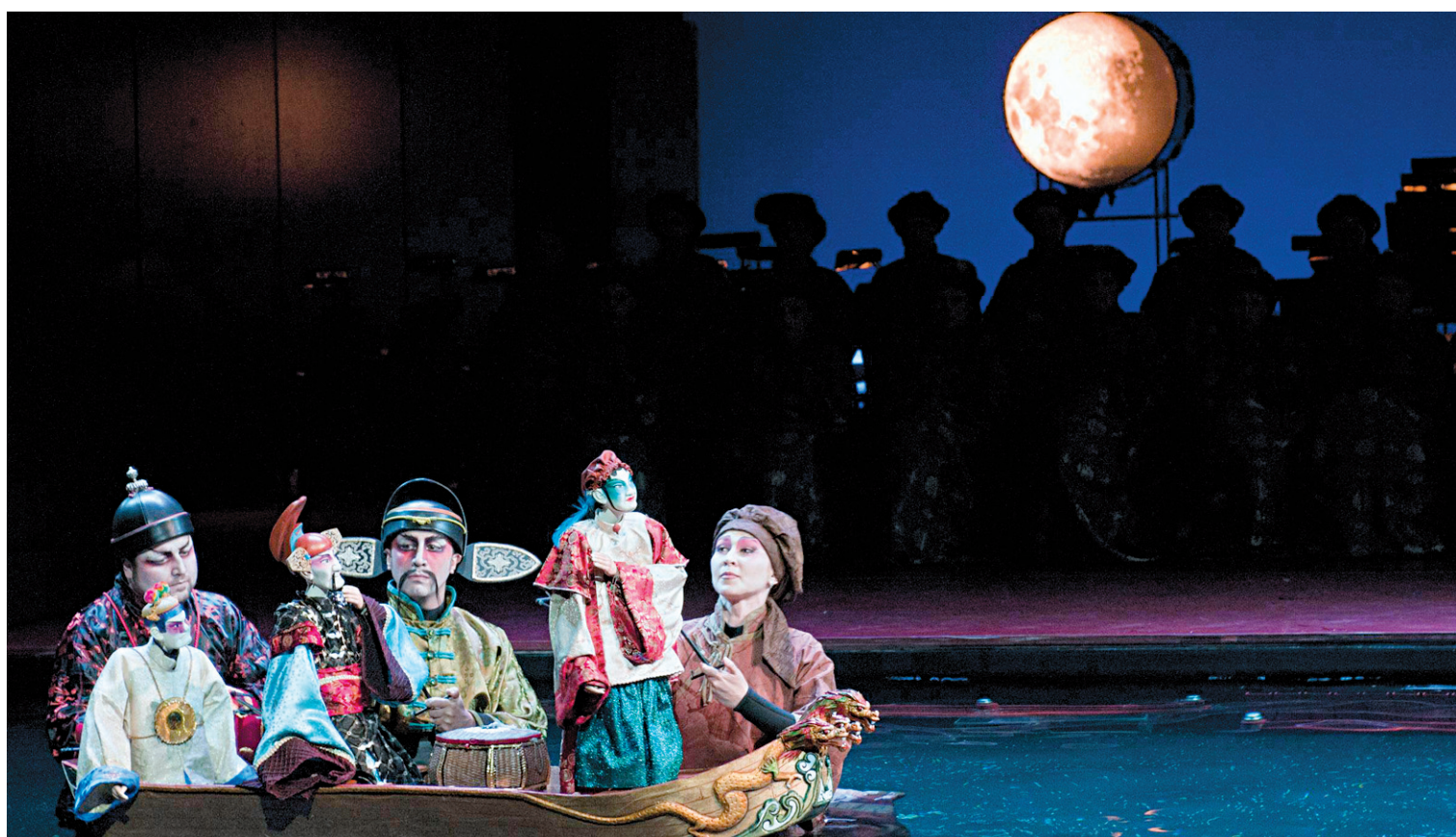
Le Rossignol et autres fables, sur des musiques d'Igor Stravinski, mis en scène par Robert Lepage