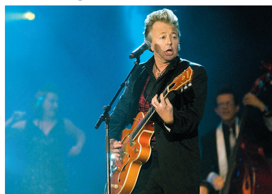
PEDRO RUIZ LE DEVOIR

Brian Setzer Orchestra au Festival international de jazz de Montréal