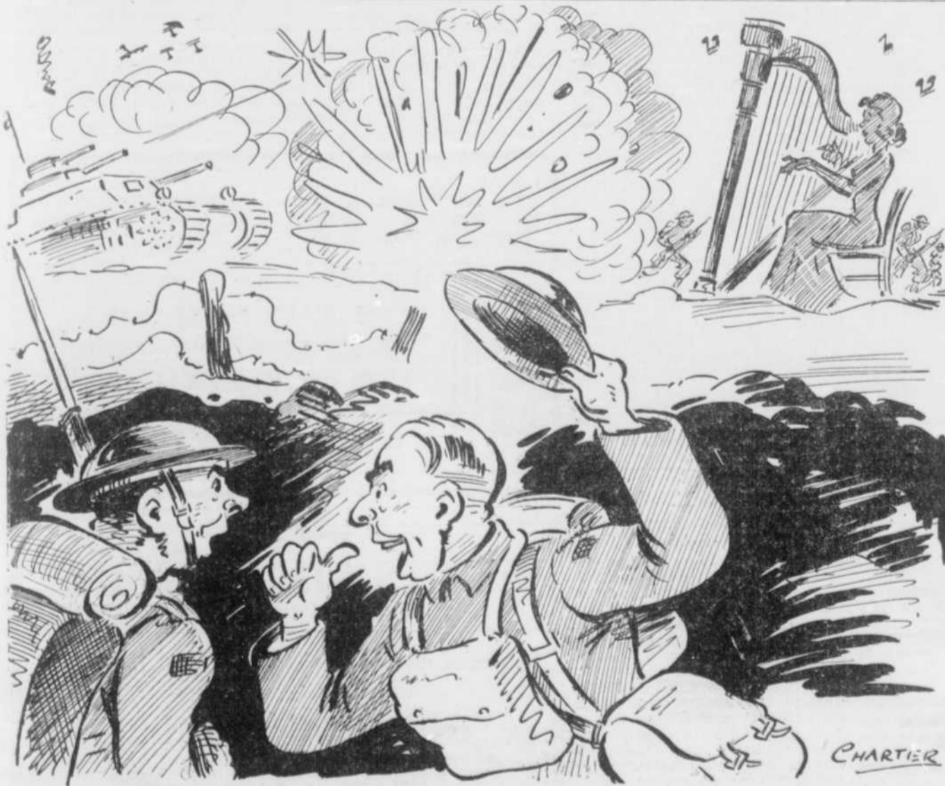
"Hourra! on peut considérer la guerre comme pratiquement finie, mon vieux! — JULIETTE DROUIN vient de m'assurer que la musique adoucit les mœurs!"