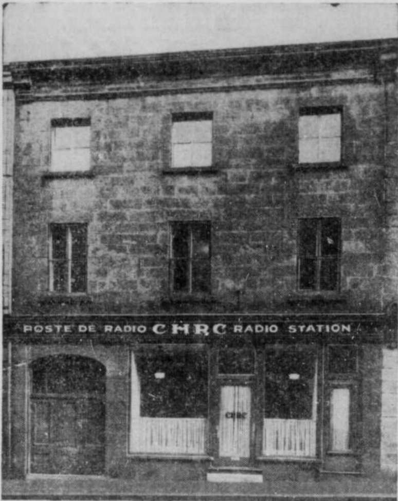
POSTE DE RADIO CHRC RADIO STATION

Nous avons le plaisir de vous présenter la photo du nouvel immeuble qu'occupe le Poste CHRC, sur la rue Buade, à Québec. C'est le plus vieux coin de l'histoire de Québec: en face de la Basilique, près du Palais Cardinaliste, du Château Frontenac, du Bureau de Poste, enfin, près de toutes les activités. CHRC occupe l'immeuble au complet — tous ses étages — avec toutes ses annexes.