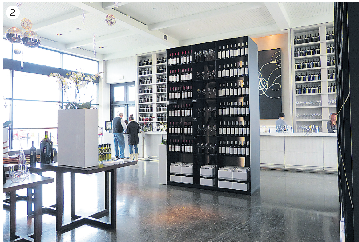
2. Une atmosphère moderne règne au vignoble Status.