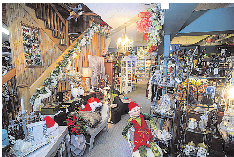
L'extérieur et l'intérieur de la boutique Cadeaux chez Guy

Dès que l'on pénètre dans les lieux, la magie opère. Des jouets, il y en a partout. Que l'on soit enfant ou adulte, on a une soudaine envie de s'asseoir par terre pour câliner l'une des nombreuses poupées, faire rouler un camion ou encore résoudre un casse-tête. Mais il y a plus. Le deuxième étage appartient littéralement au père Noël et à ses lutins. Ouvert toute l'année, l'étage nous plonge dans une ambiance féérique : le foyer sur lequel on a accroché des chaussettes, les arbres illuminés, les animaux grandeur nature... Un arrêt obligé pour les amoureux de Noël.