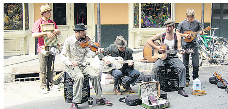
À La Nouvelle-Orléans, la musique est omniprésente dans les rues.