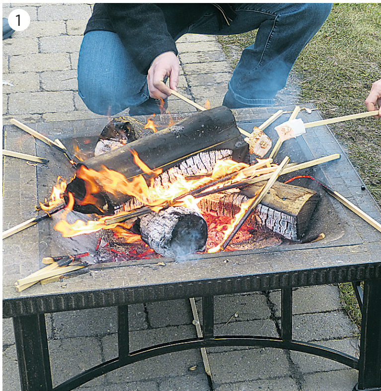
1. Au Peller Estates, le chef a eu l'idée originale de fabriquer de grosses guimauves que les gens font griller au-dessus d'un feu de bois extérieur.