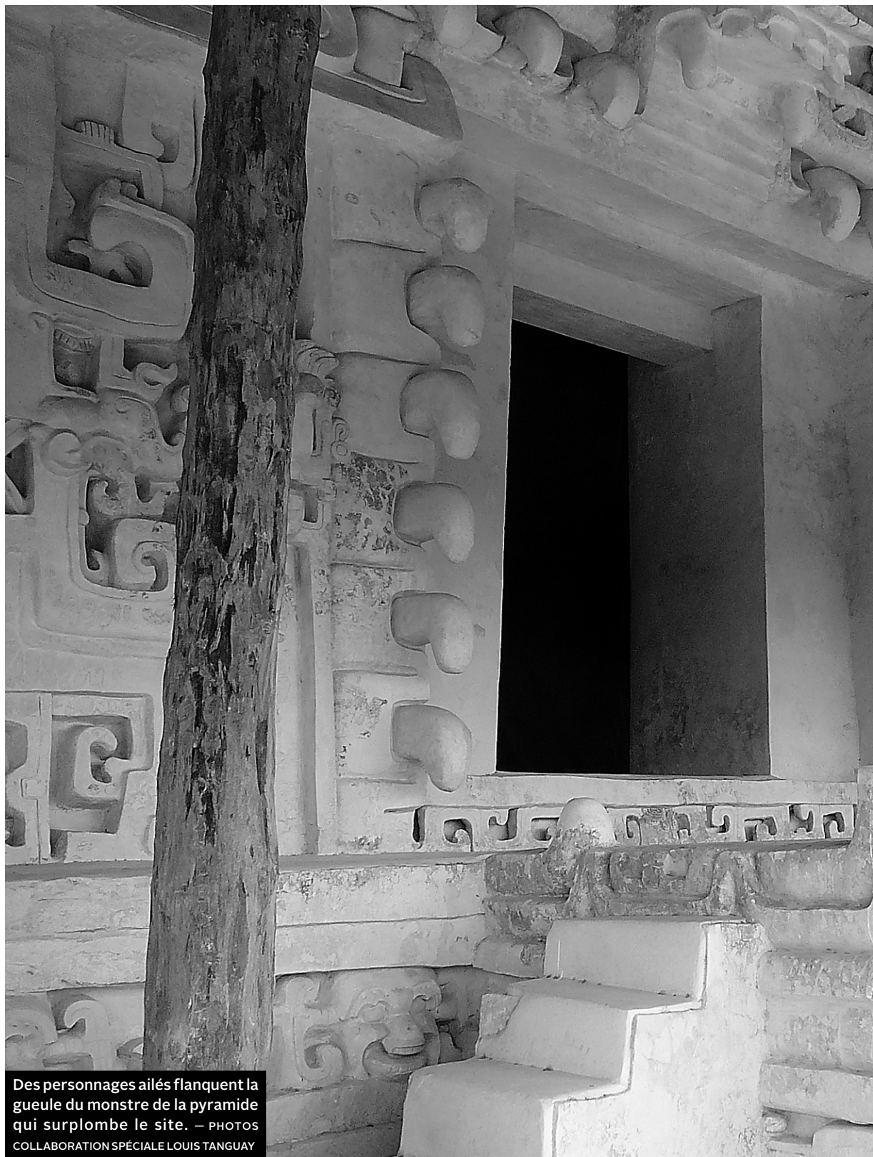
Des personnages ailés flanquent la gueule du monstre de la pyramide qui surplombe le site.

La joute servait, dit-on, à déterminer qui aurait l'honneur d'être