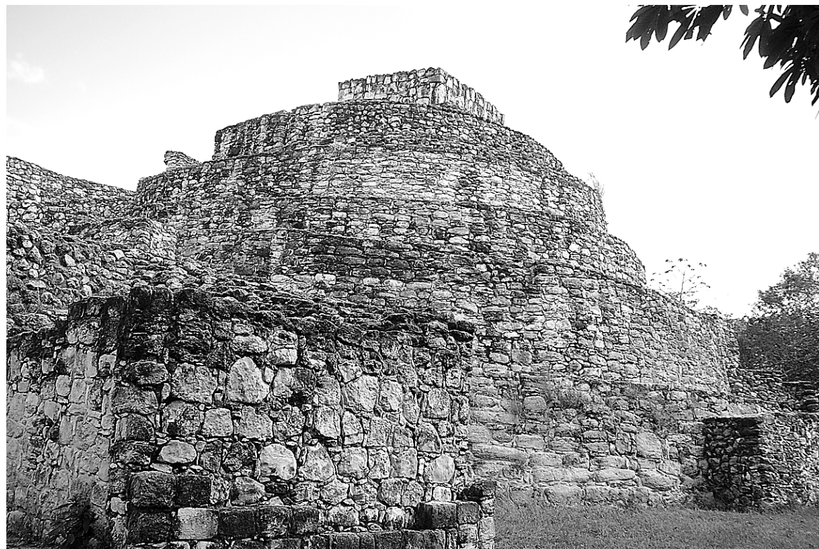
C'est surtout vu de l'arrière que le palais Ovale porte bien son nom.