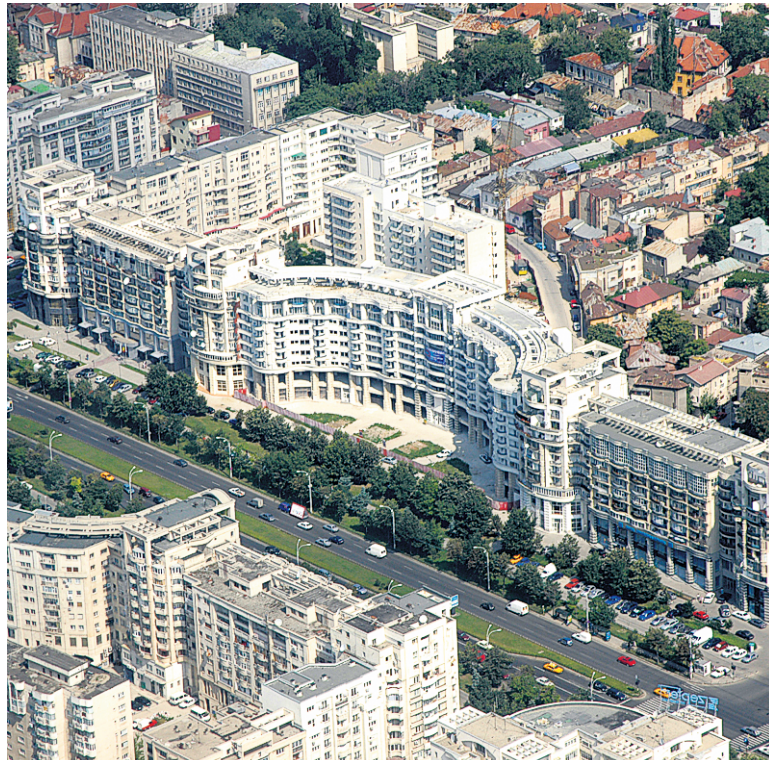
La Roumanie et la Bulgarie accueillent de plus en plus d'étrangers, dont plusieurs s'installent à Bucarest.