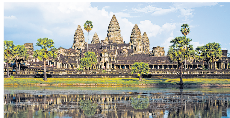
Le Cambodge est moins cher que la Thaïlande et encore moins fréquenté par les touristes.