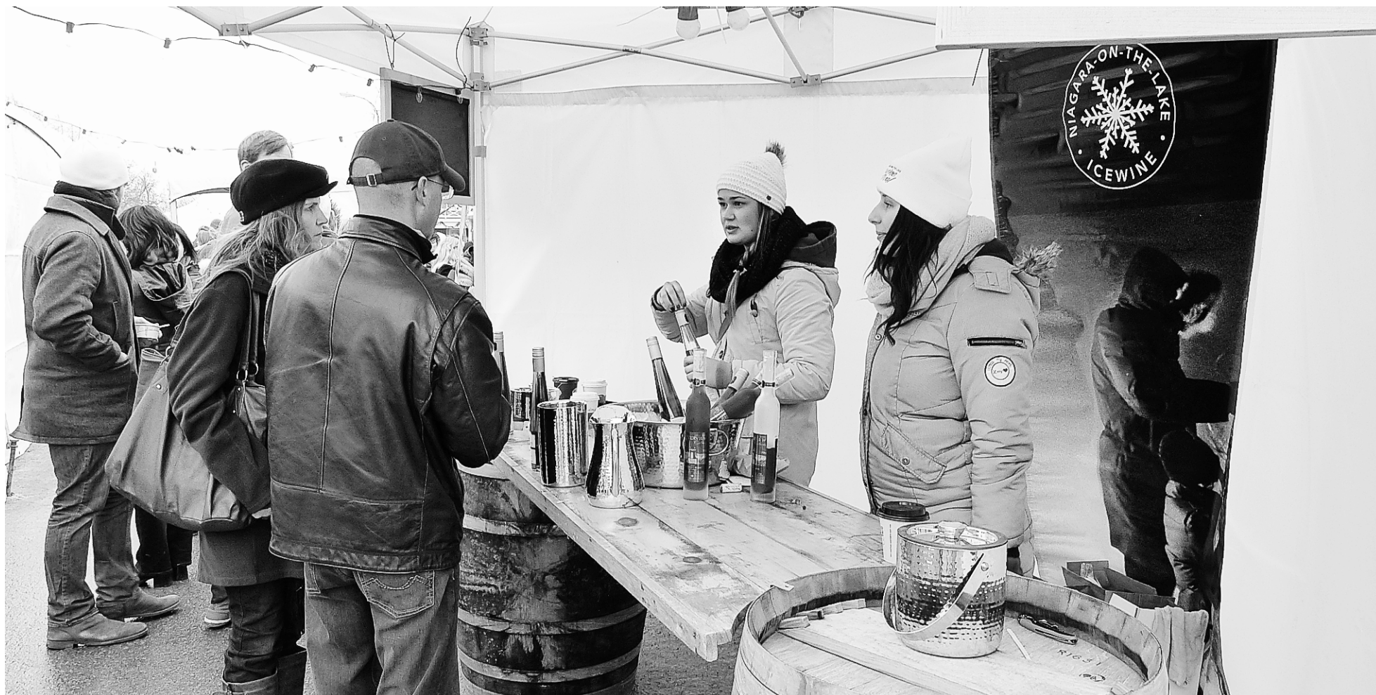
Bien emmitoufflés dans leur manteau d'hiver, les gens vont d'un kiosque à l'autre sur la rue Principale de Niagara-on-the-Lake et dégustent les divers cocktails élaborés par les vignerons.