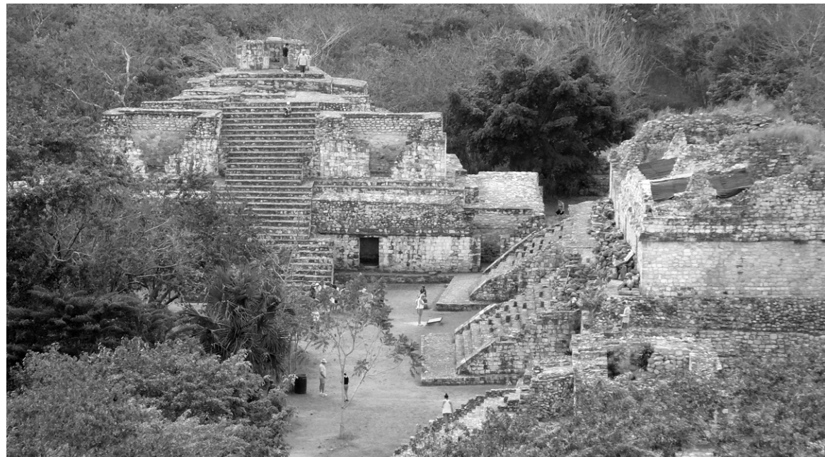
Vue du sommet de la pyramide d'Ek Balam, avec le palais Ovale et les palais Jumeaux

Le site est ouvert de 8h à 17h. On y arrive par la route 295, à une trentaine de kilomètres à l'est de la route 180 D. La jonction se trouve à environ 140 kilomètres au nord de l'aéroport de Cancún.