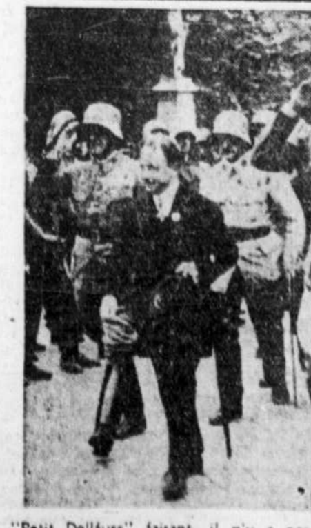
Le "Peit Dollfuss" faisant, il n'y a pas longtemps, le revue de l'infanterie autrichienne.