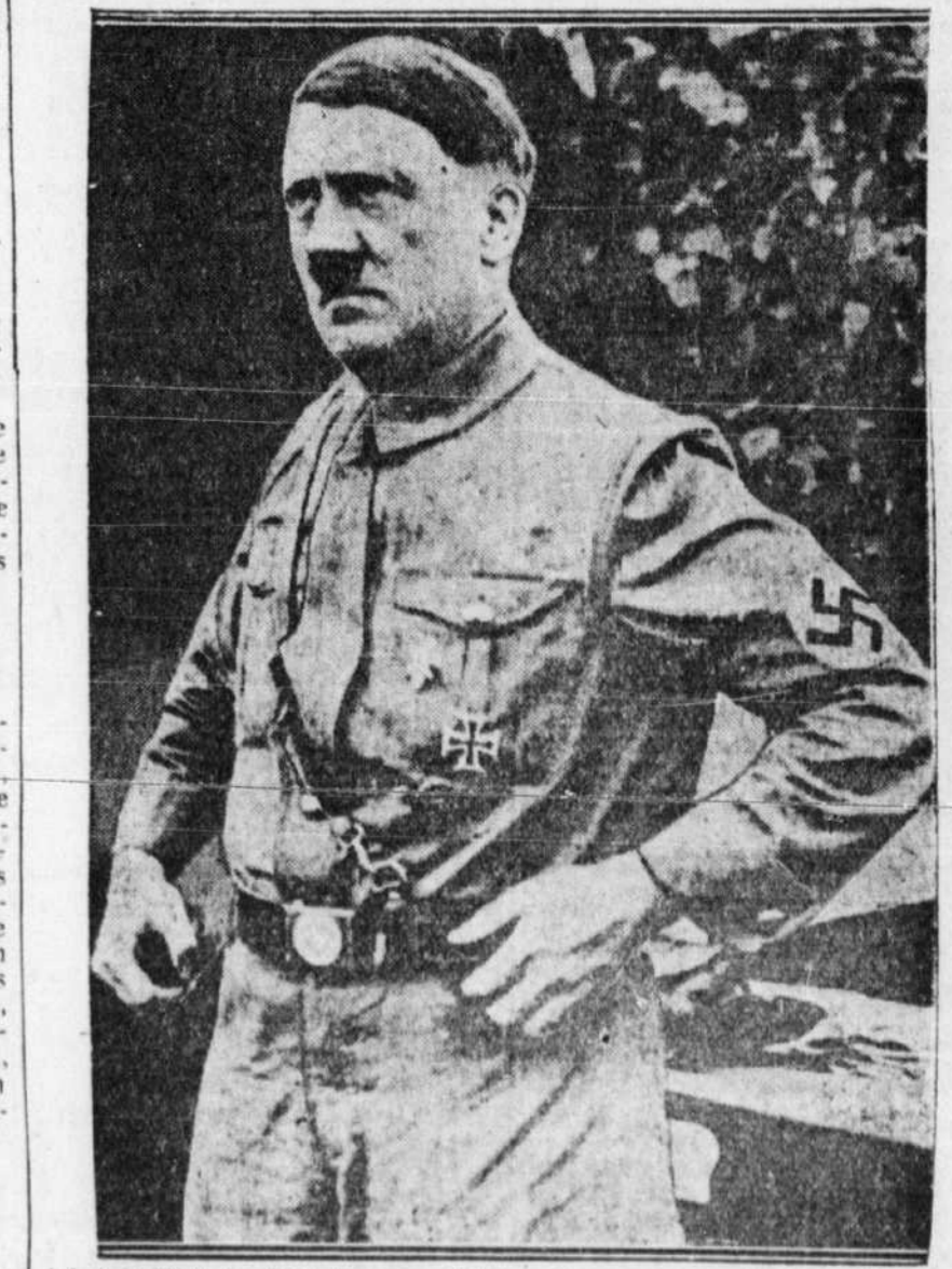
Adolph Hitler est pratiquement le roi non couronné de l'Allemagne. Après le décès du maréchal von Hindenburg, il s'est fait nommer président tout en gardant les fonctions de chancelier. Il se trouve commandant en chef des armées allemandes.

naux de publier au texte ce communiqué officiel. Pour notre part, nous n'avons pas eu le courage d'imposer à nos lecteurs ce martyre de délayer cette prose cimentée de subjonctifs et bétonnée de participes présents. Est-ce mal? —