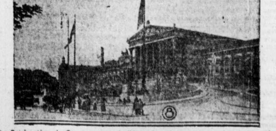
Le Reich, siège du Gouvernement de l'Autriche, où se passent en ce moment des événements graves qui jettent le monde dans l'angoisse.

Adressez-vous au Service de librairie du "Devoir", 430 rue Notre-Dame est, Montréal. (Téléphone: HARBOUR 1241).