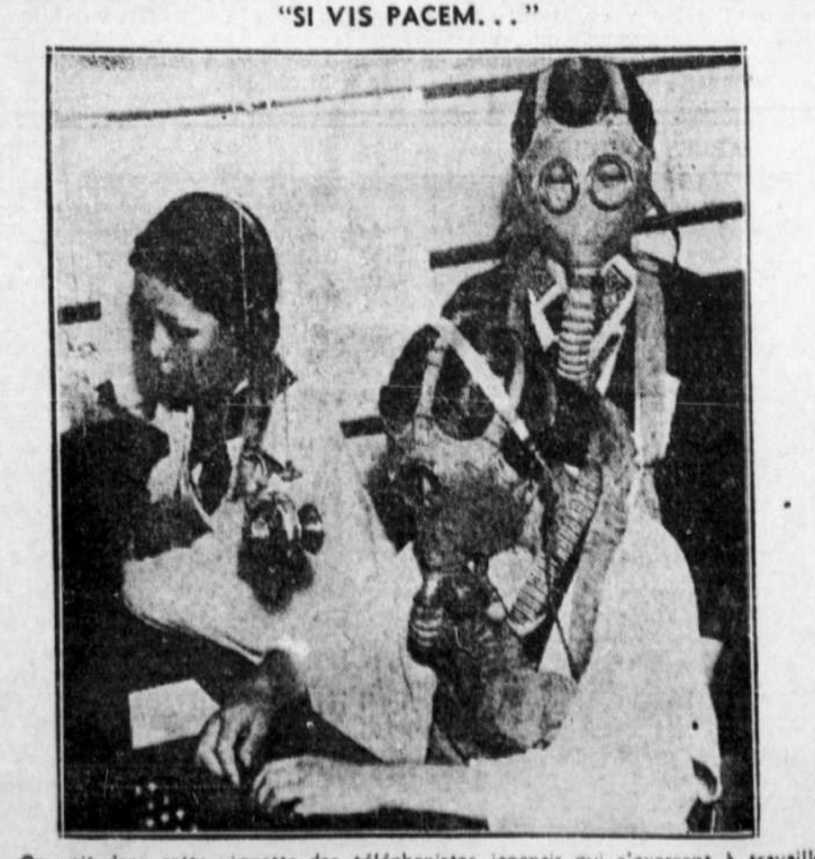
On voit dans cette vignette des téléphonistes japonais qui s'exercent à travailler avec des masques protecteurs contre les gaz asphyxiants afin d'être familiers avec ces masques au cas où une guerre éclaterait.

Avis à ceux qui voyagent Tous billets, Europe et partout, émis au tarif des compagnies — Hôtels assurances bagages et accidents, chèques de voyages, passeports, etc. — Service complet — Le DEVOIR-VOYAGES, 4361 Notre-Dame Est. Téléphonon HARBOUR 1241*