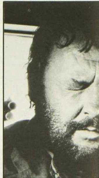
«Il était une fois la révolution»

Nick Devlin est délégué à Kansas City par un chef du syndicat du crime de Chicago pour mettre à la raison un racketeer local, surnommé Mary Ann, qui refuse de payer ses redevances à l'organisation centrale. Le premier affrontement donne à Nick l'occasion de venir à la rescousse d'une orpheline, Poppy, entraînée malgré elle à la prostitution. Constatant l'intérêt porté par Nick à Poppy, Mary Ann fait enlever l'adolescente pour s'en servir comme atout dans le conflit. Ce geste déclenche un sanglant règlement de comptes dont Devlin sort vainqueur. Un film de gangsters qui se passe en milieu rural où «les tueries et autres douceurs du genre se déroulent dans un décor agreste». Un western au vert.