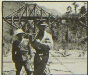
«Le Pont de la rivière Kwai»

On a dit que ce film de David Lean se classe parmi les grandes oeuvres du cinéma, tant pour ses qualités techniques et dramatiques que pour sa valeur psychologique et humaine. On a aussi loué le jeu excellent des acteurs du Pont de la rivière Kwai .