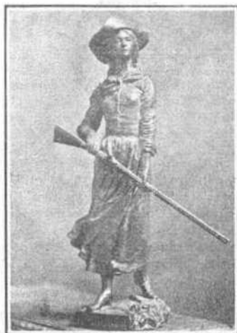
MADELEINE DE VERCHÈRES