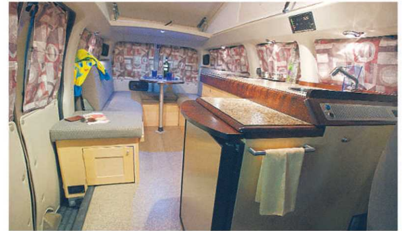
Profitez des journées portes ouvertes pour visiter l'intérieur redessiné de l'Expédition 2010.

des sièges passagers. De plus, vous pouvez dorénavant dormir dans le sens de la longueur du véhicule, ce qui est bien plus pratique pour se relever! «Un bel atout du nouveau modèle est la fonctionnalité de la cuisinière à l'alcool. Aussi, comme il était très apprécié, nous y avons intégré le grand réfrigérateur de 4,3 pi 3 , anciennement réservé au modèle Migration. Enfin, tout l'habitacle a été repensé afin de loger au maximum et les deux coffres arrière sont maintenant disponibles pour le rangement. Comme nous ne serons pas au salon des VR, j'invite les gens à venir nous rencontrer à nos bureaux, qui seront exceptionnellement ouverts pour la fin de semaine du 27 et 28 mars», explique M. Jean Dumais, concepteur du produit et propriétaire de l'entreprise.