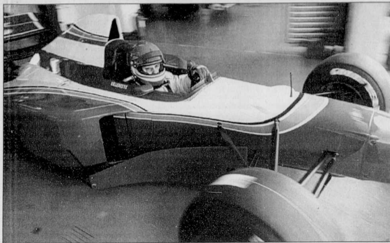
Jacques Villeneuve s'apprête à entrer en piste pour sa deuxième journée d'essais.