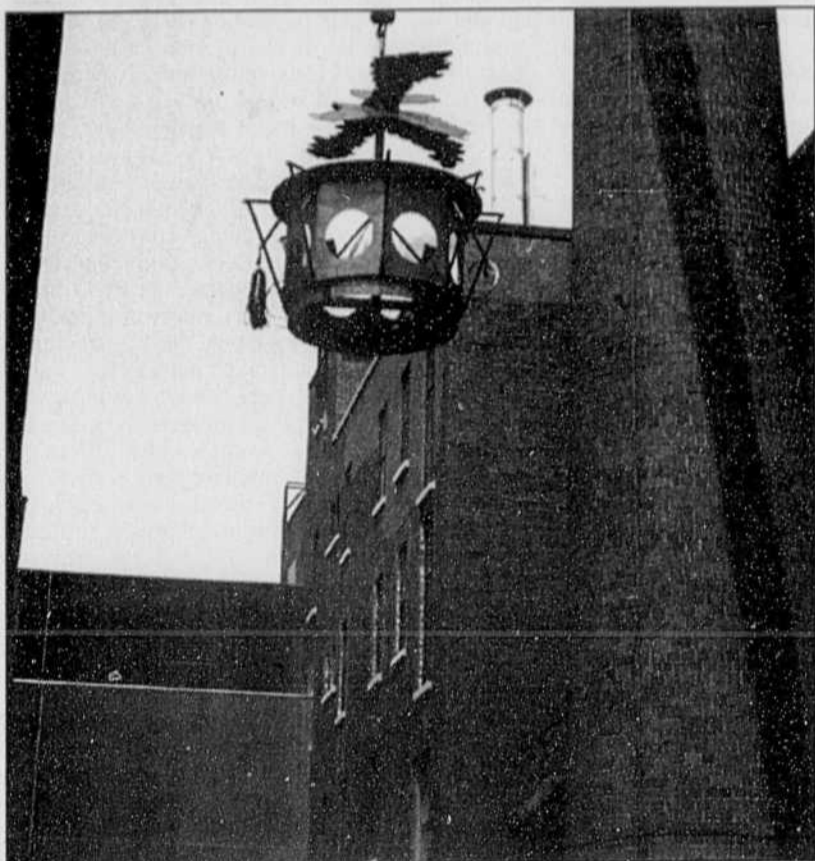
Deus ex machina, en montage, de Richard Purdy et François Hébert.